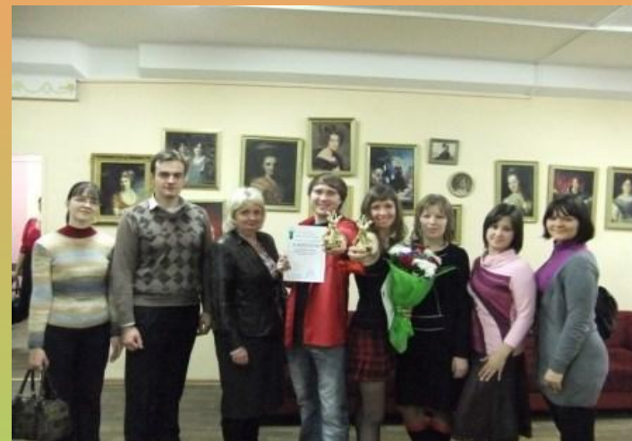
и другие мероприятия