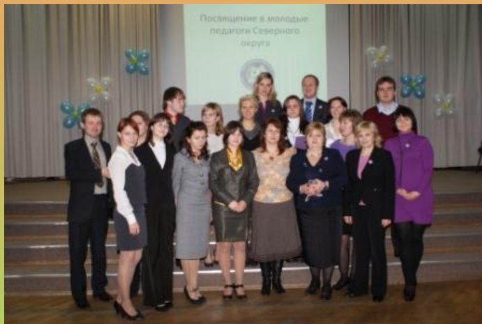
Посвящение в молодые педагоги