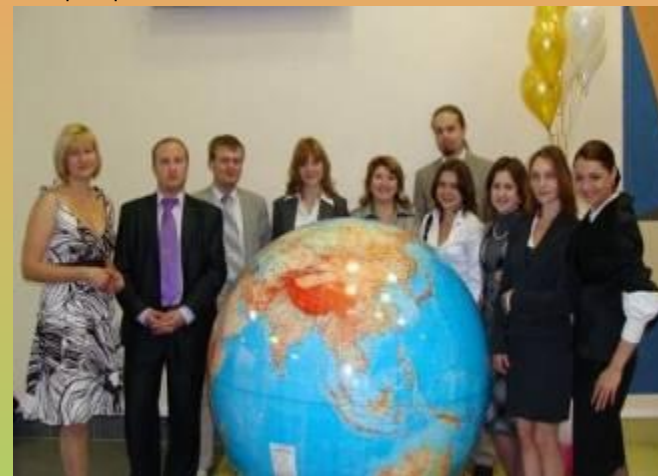
и другие окружные мероприятия