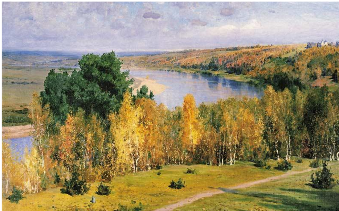
В.Д.ПОЛЕНОВ «ЗОЛОТАЯ ОСЕНЬ» 1893