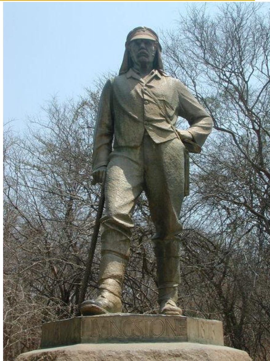
Памятник Давиду Ливингстону у водопада Виктория