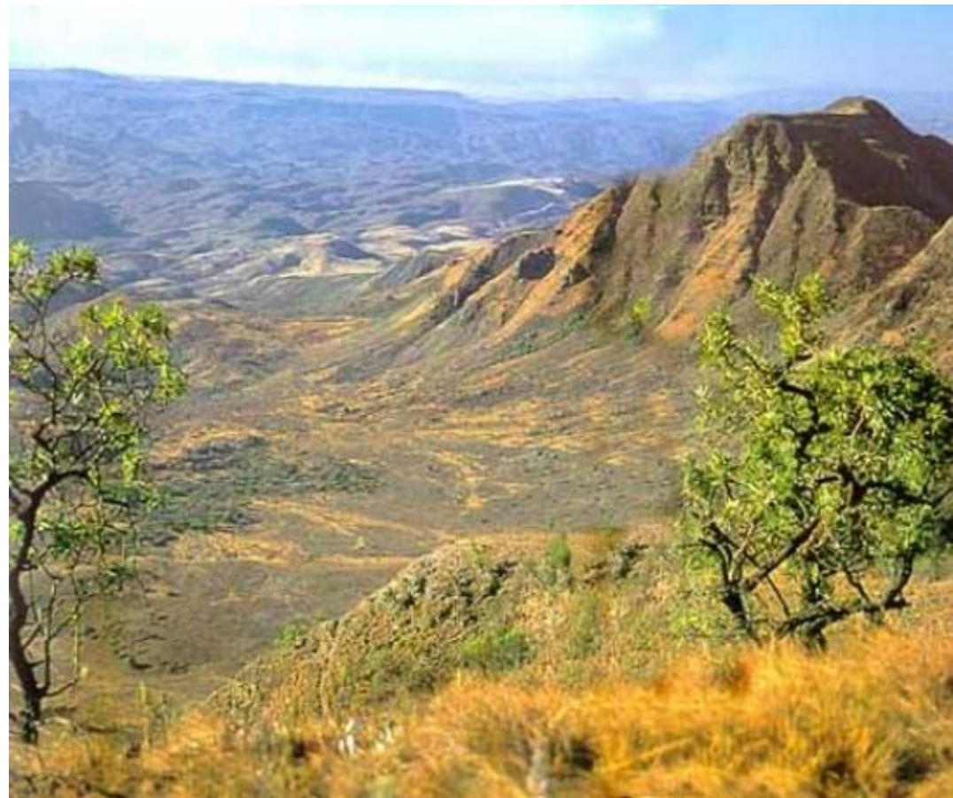
Горы Ливингстона в Танзании