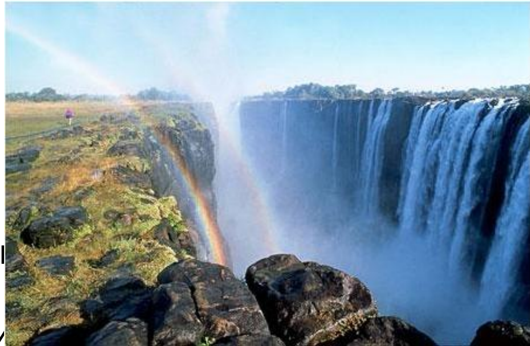
Водопад Виктория на реке Замбези