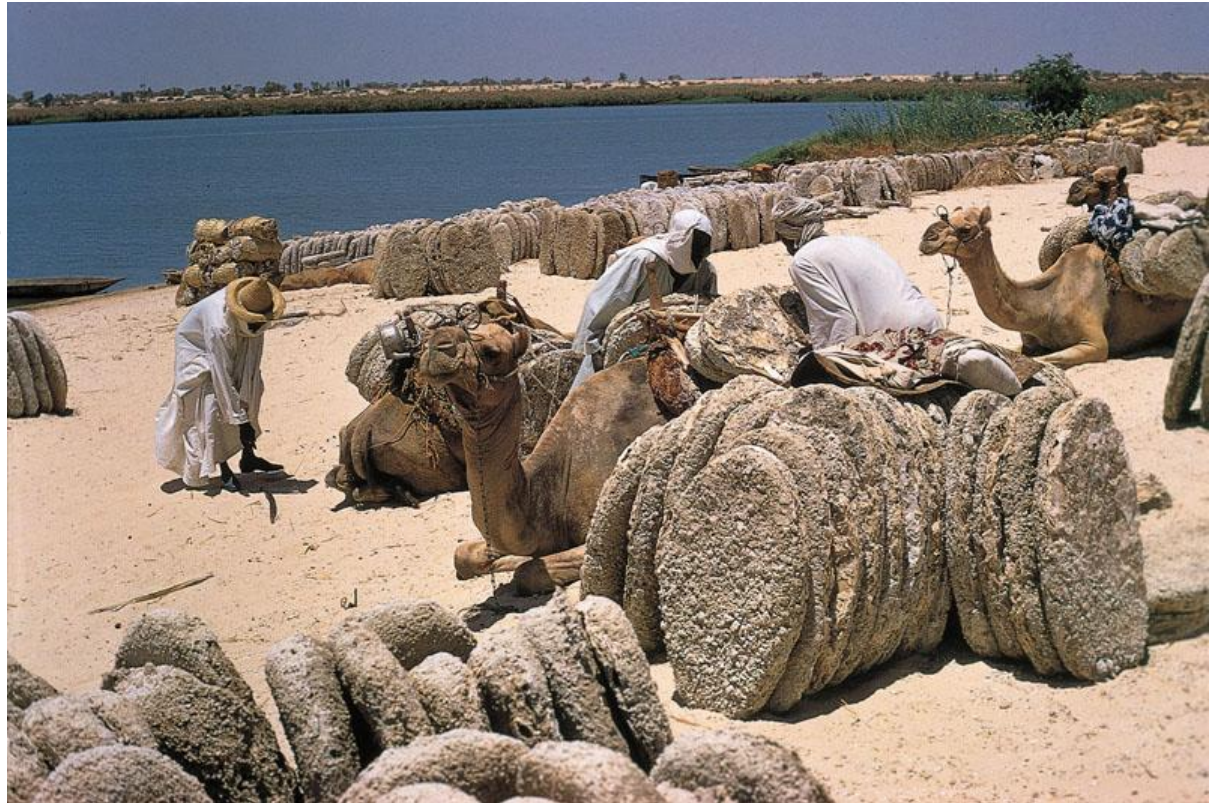
Караван верблюдов с погонщиками на берегу озера Чад