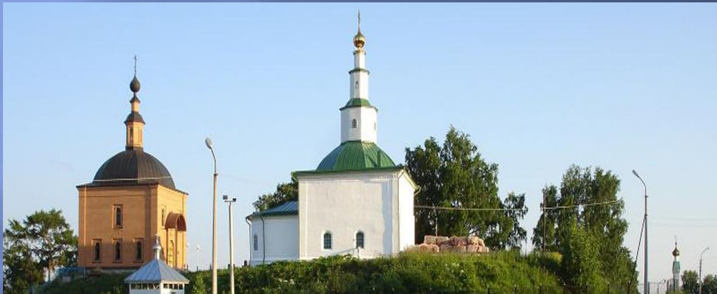
Михайло-Архангельский мужской монастырь в селе Усть-Вымь основан в XIV в. епископом Стефаном Пермским