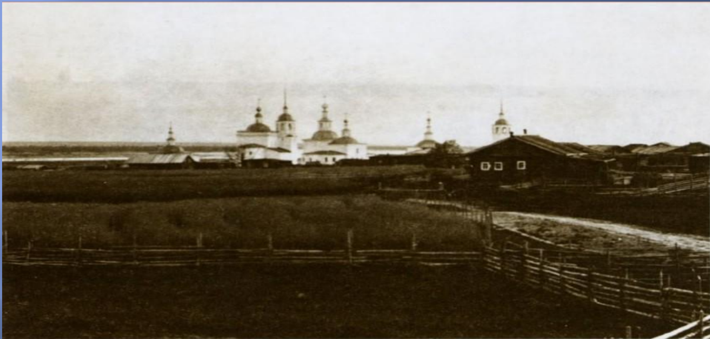
Село Усть-Вымь. Усть-Вымской волости Яренского уезда. Фотография. 4—28 июня 1910 года. № 29549-18. ВГИАиХМЗ