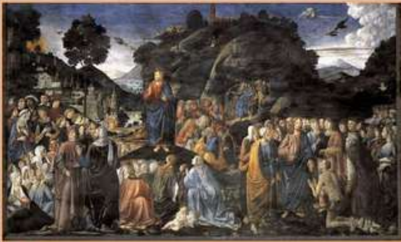
Козимо Росселли. Нагорная проповедь

Все стремились прикоснуться к Спасителю, потому что от Него исходила сила и исцеляла всех. Видя перед Собой множество народа, Иисус Христос, окруженный учениками, взшел на возвышение у горы и сел, чтобы учить народ.