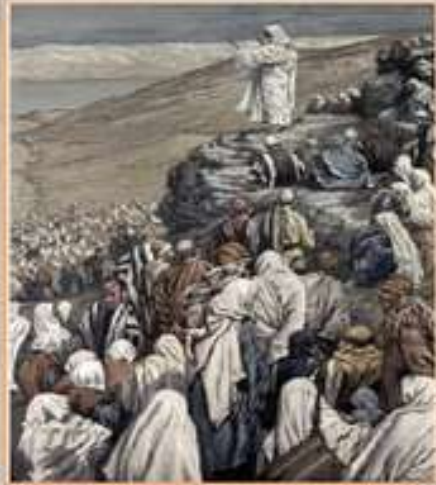
Джеймс Тиссо. Нагорная проповедь.