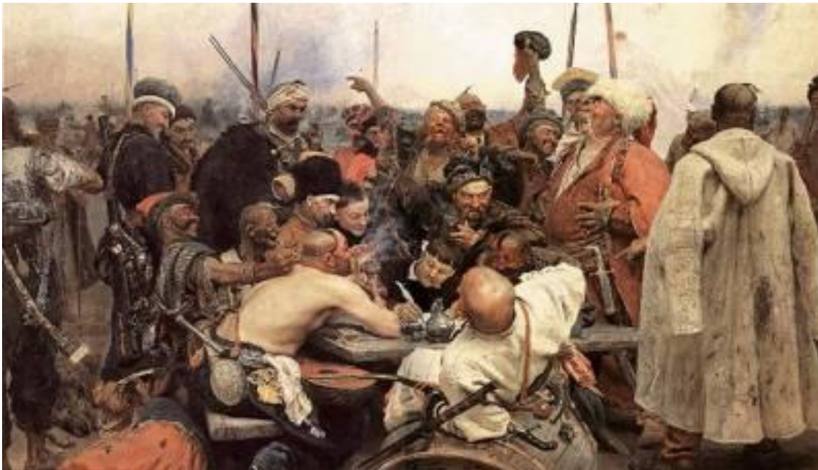
И.Е.Репин «Запорожцы пишут письмо турецкому султану»