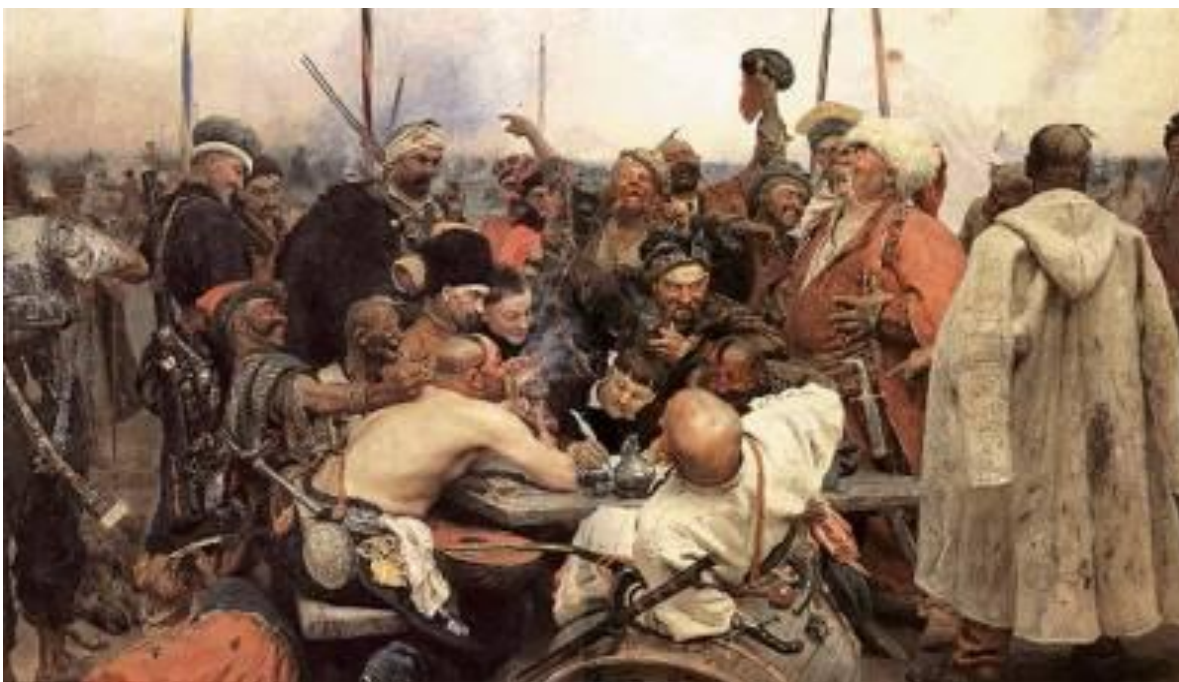
И.Е.Репин «Запорожцы пишут письмо турецкому султану»