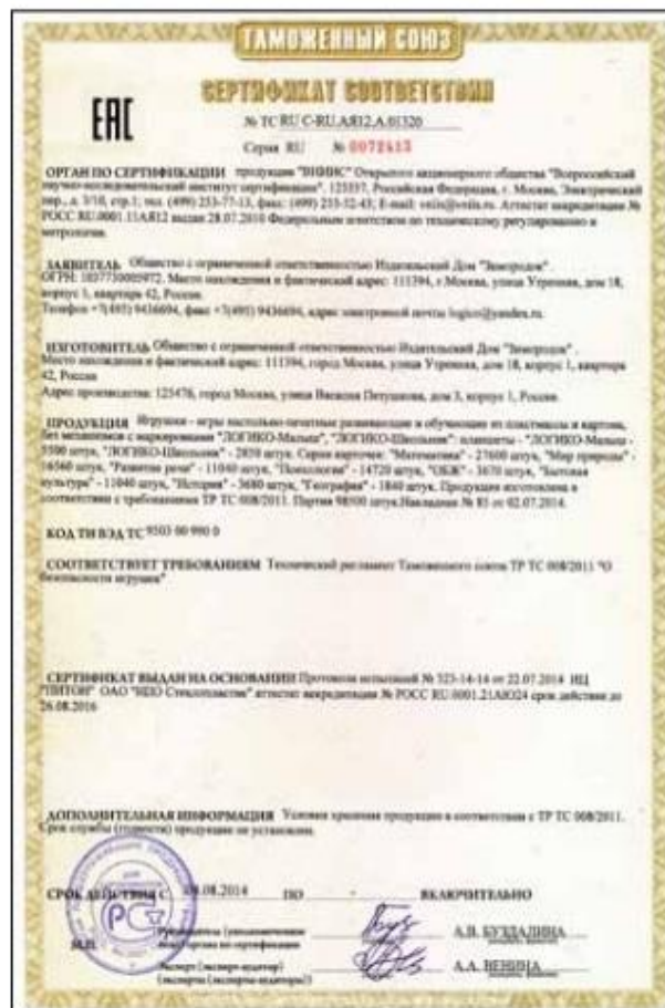
Сертификат соответствия таможенного союза