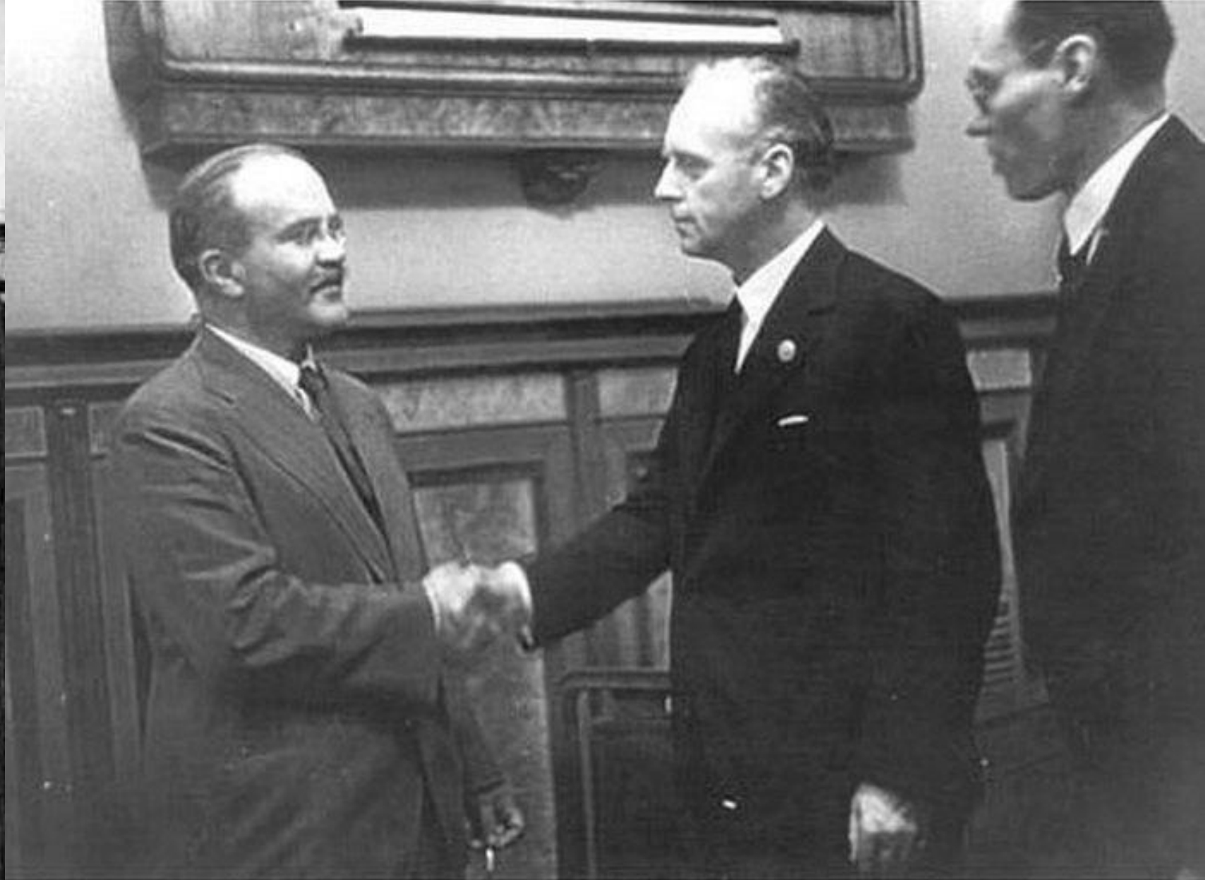
Вячеслав Молотов и Иоахим Риббентроп во время подписания пакта о ненападении между СССР и Германией