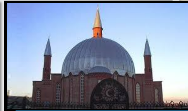
Соборная мечеть (г. Новосибирск)