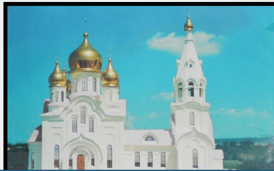
Храм Святых Апостолов Петра и Павла (г.Шелехов)