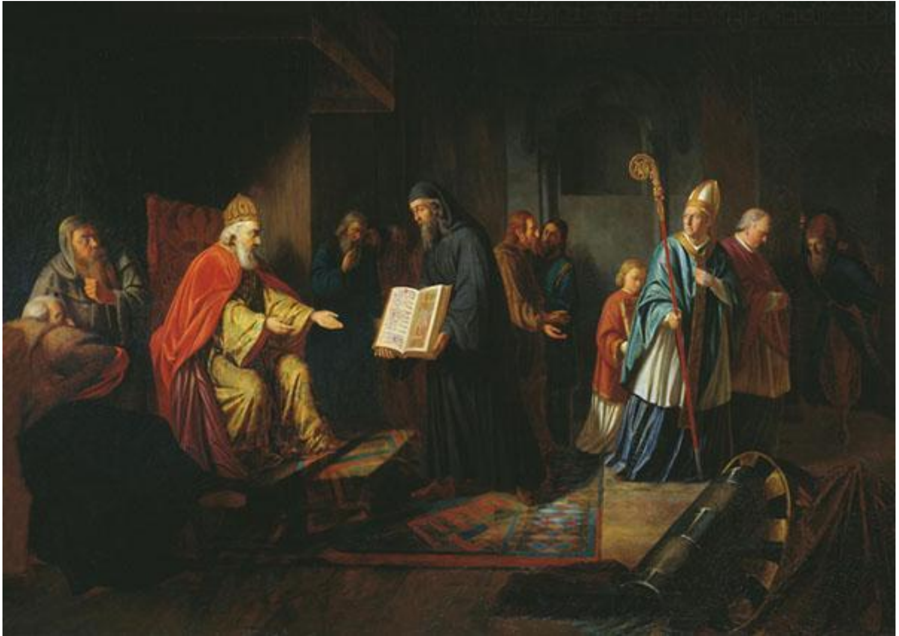
Иван ЭГГИНК (1787–1867), «Великий князь Владимир выбирает веру»