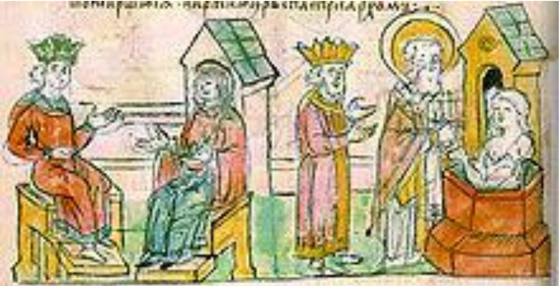
Крещение Ольги в Царьграде.