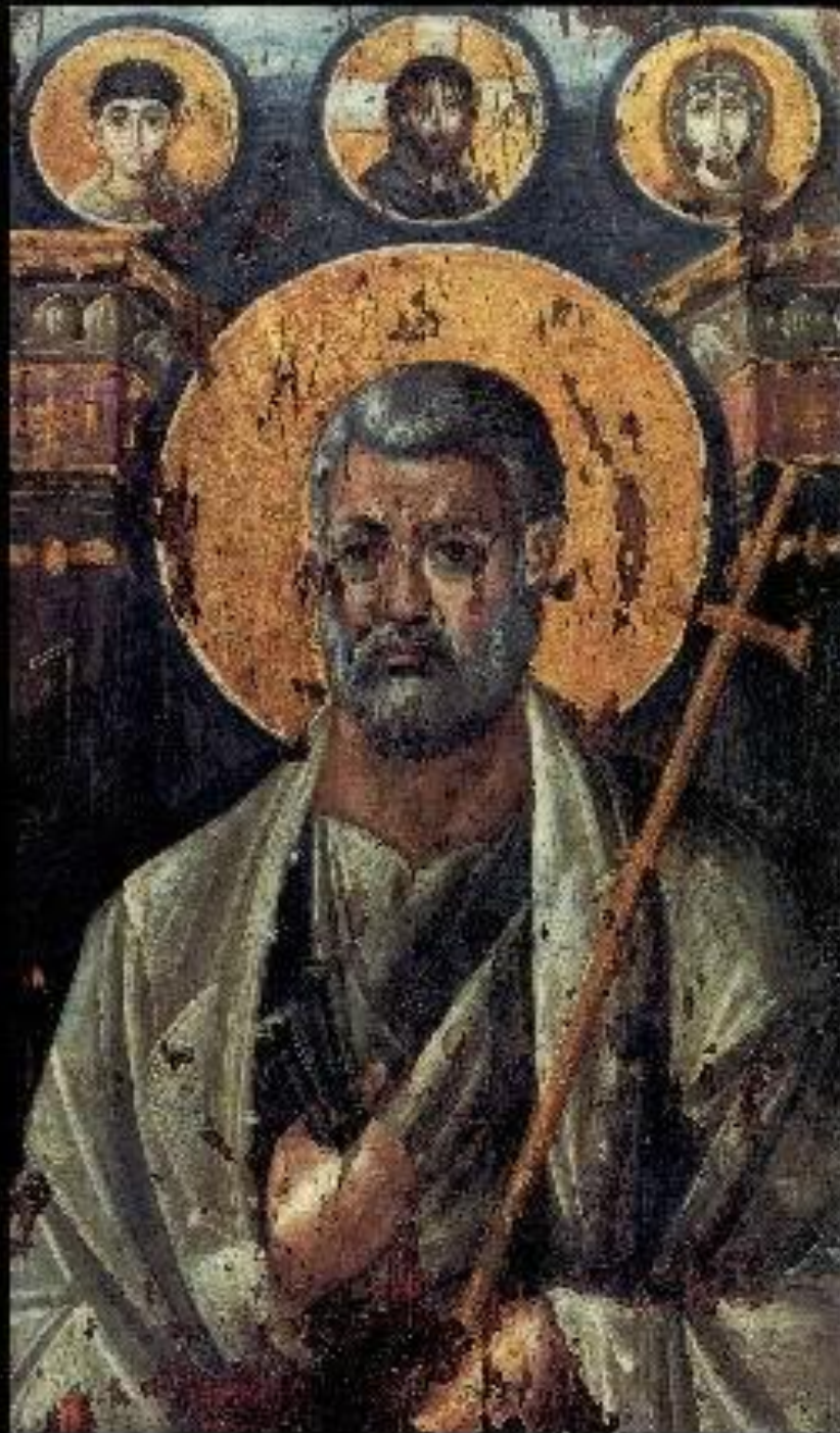
Св. апостол Петр