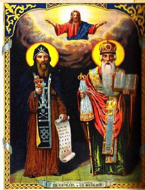
Братья из Солуни Кирилл и Мефодий, славянские проповедники, создатели славянской азбуки. Хромолитография. 1914 г.