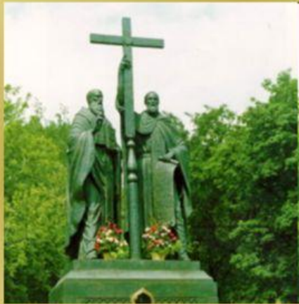
Памятник Кириллу и Мефодию

Ежегодно 24 мая во всех славянских странах торжественно прославляют святых Кирилла и Мефодия - создателей славянской письменности.