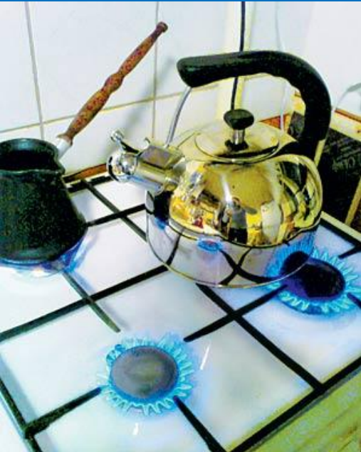
газовая плита для приготовлен ия пищи