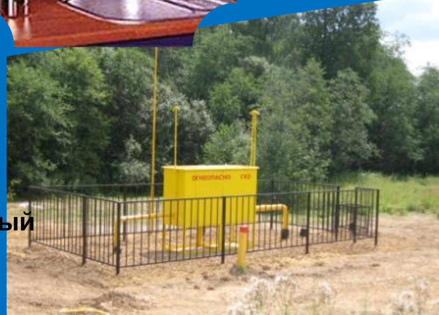
городской магистральный газ