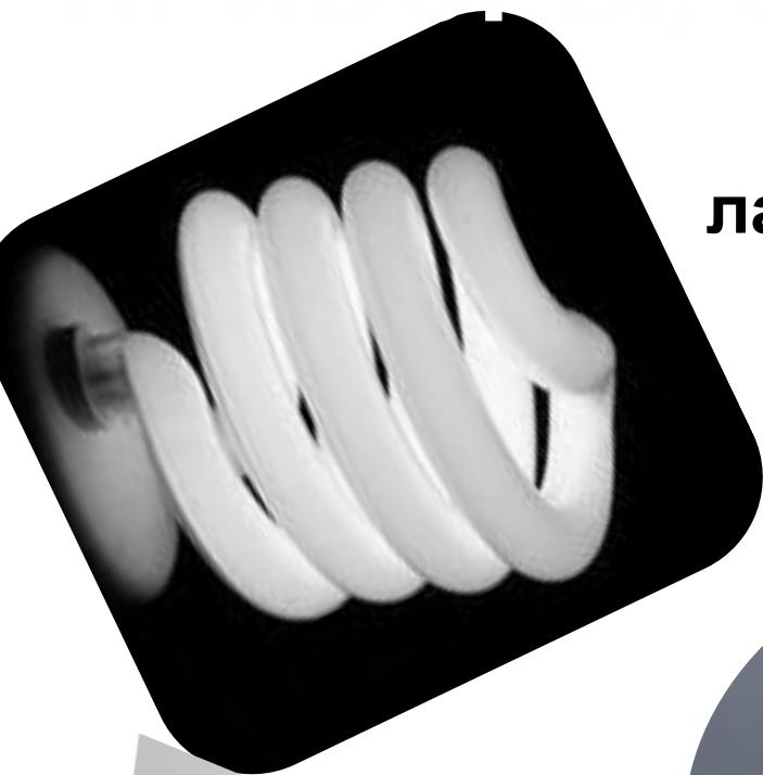
лампы дневного света