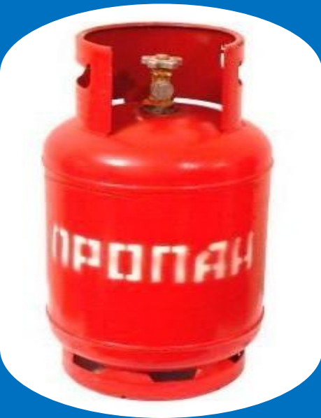
сжиженный газ в баллонах