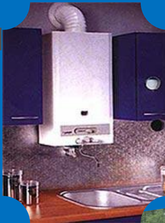
газовая колонка для подогрева воды