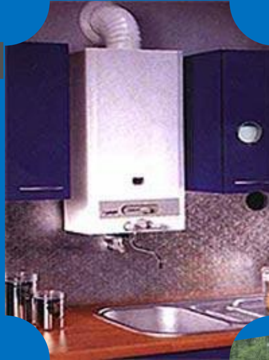
газовая колонка для подогрева воды