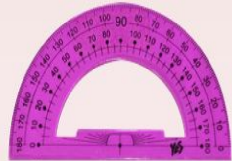
Транспортир для измерения величины угла.

Получение информации – это действия с информацией.