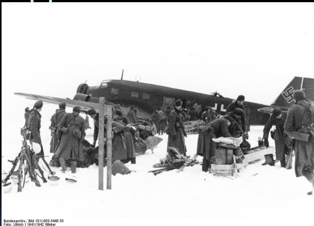
1941/1942 Winter

Цель работы: Выявить цель действий советского союза, и выяснить, были ли оправданы неожиданные потери большого количества людей со стороны СССР из-за смекалки немцев.