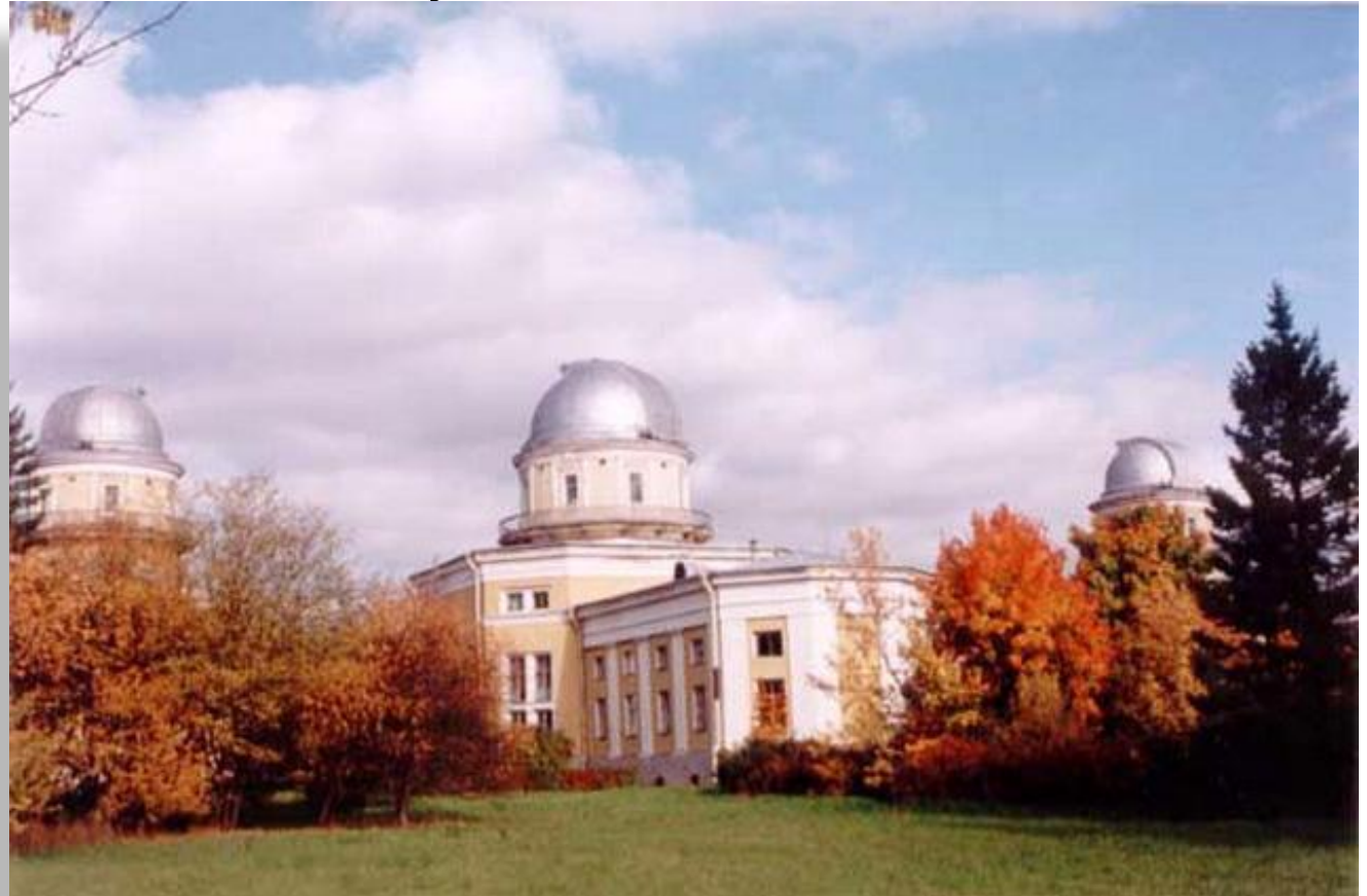
Первая обсерватория в России, основанная Петром I.

Замечательные успехи в петровское время были достигнуты в развитии науки: географии, физике, механике, в поисках новых торговых путей, в картографии, в изучении ископаемых богатств страны. В 1697 году В.Атласов провел экспедицию на Камчатку. В начале XVIII века была открыта северная группа Курильских островов. Большие достижения характерны для этого времени в практической механике. Собирались коллекции по минералогии и металлургии, ботанике, биологии и т.п. была организована обсерватория. Для развития и распространения научных знаний в Петербурге была учреждена Академия наук.