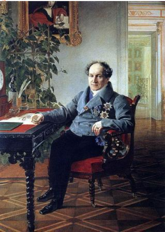
Князь Александр Николаевич Голицын. Худ. К.П. Брюллов.

Для распространения мистических идей в России в 1813 г. было создано Библейское общество.