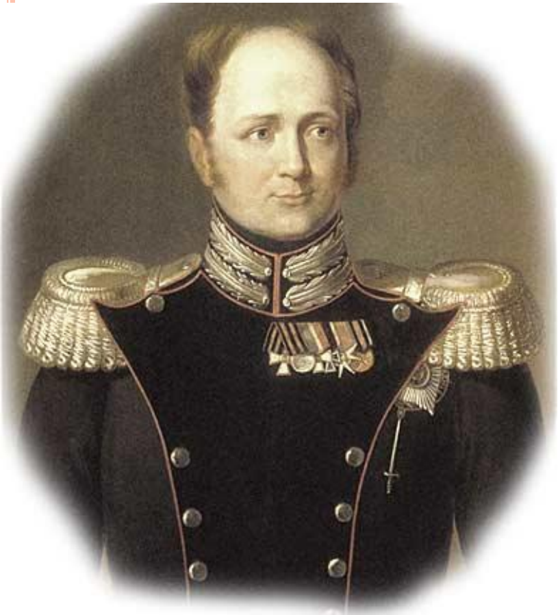
Александр I в мундире лейб-гвардии саперного батальона.

Ни один реформаторский проект Александра I, за исключением польской конституции, не был воплощен в жизнь.