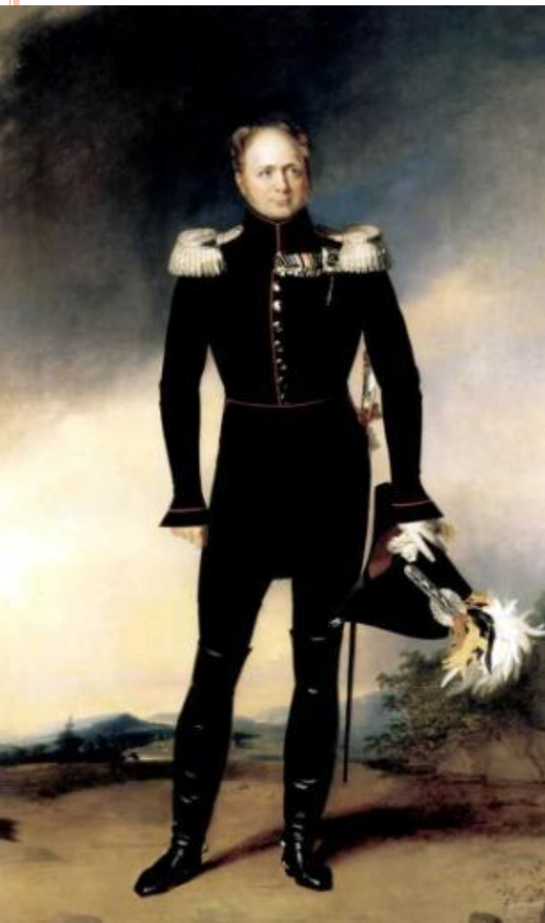
Портрет императора Александра I. Худ. Дж. Доу.

Попытки царя победить к таким же ходатайствам русских и украинских помещиков оказались тщетными.