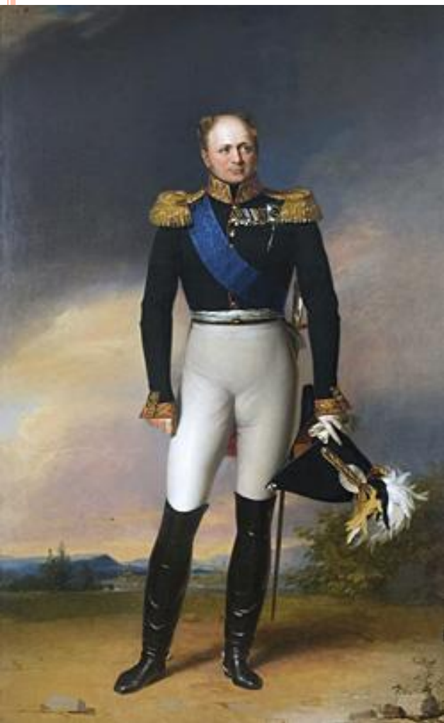
Портрет императора Александра I. Худ. Дж. Доу.

При открытии польского сейма в 1818 г. царь заявил: