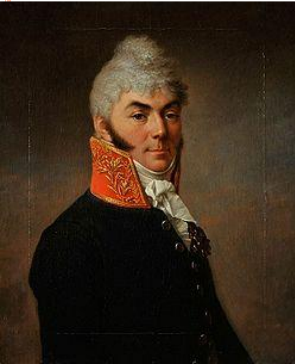
Н.Н. Новосильцев. Худ. С.С. Щукин.

В 1818–1820 гг. в Варшаве под руководством Н.Н. Новосильцева был составлен проект конституции России – «Уставная грамота Российской империи».