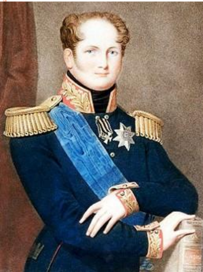
Александр I. Гравюра с оригинала худ. Ф.И. Волкова, 1814 г.

Победа над Наполеоном вознесла Александра I на вершину могущества, дала ему колоссальный авторитет.