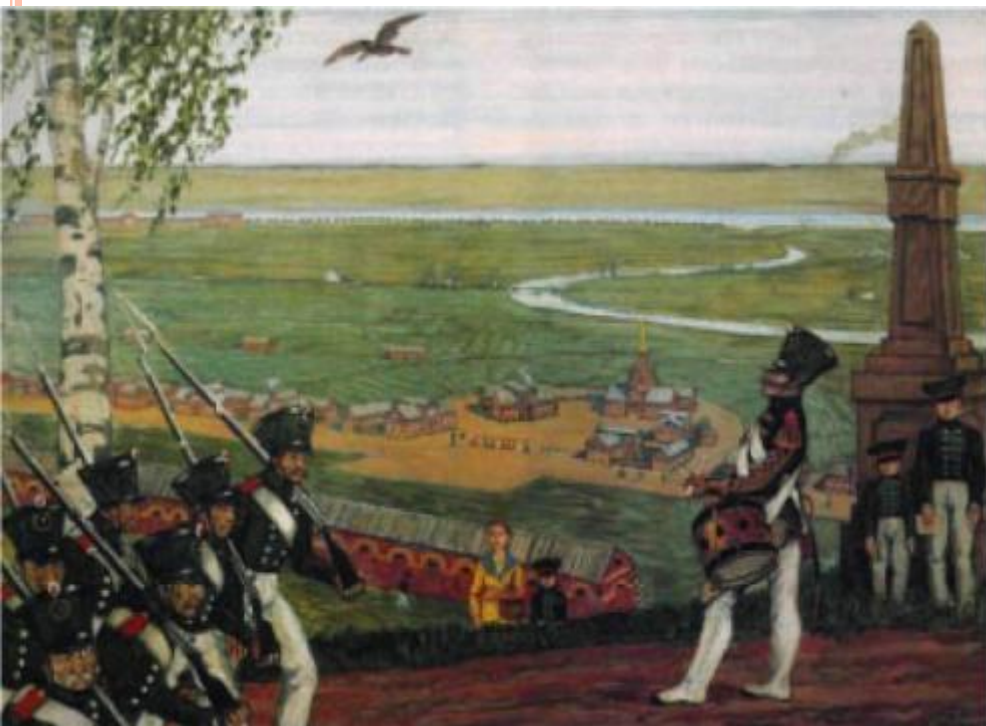
В военном поселении. Худ М.В. Добужинский.

Красивый замысел, увы, обернулся кошмаром. Мелочная регламентация всей жизни, муштра, невозможность уходить на заработки превратили жизнь поселян в каторгу.