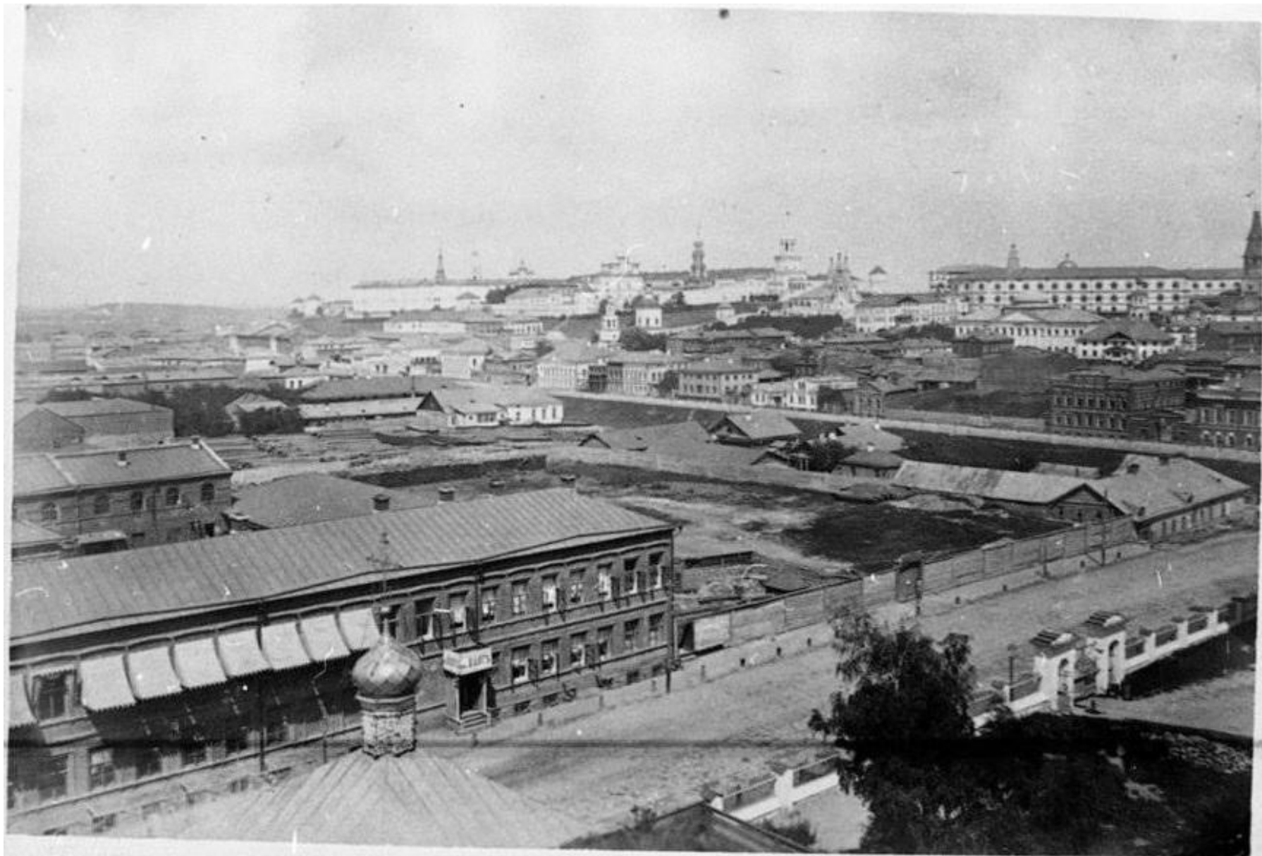
1879 – вид с Владимирского собора