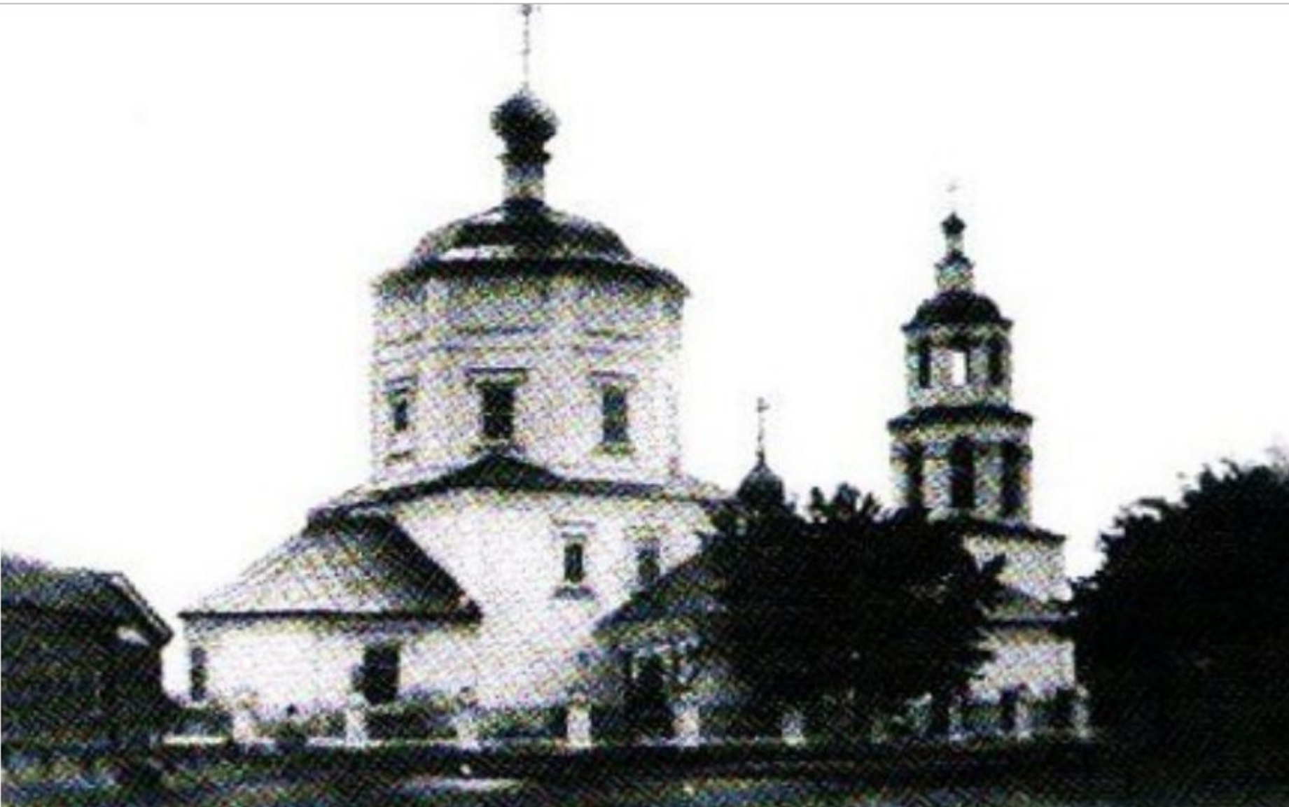
1726 – церковь Смоленской иконы Божией Матери (Варлаамская) /Колхозный рынок