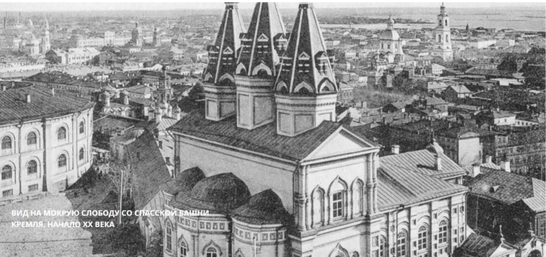
ВИД НА МОКРУЮ СЛОБОДУ СО СПАССКОЙ БАШНИ КРЕМЛЯ, НАЧАЛО XX ВЕКА