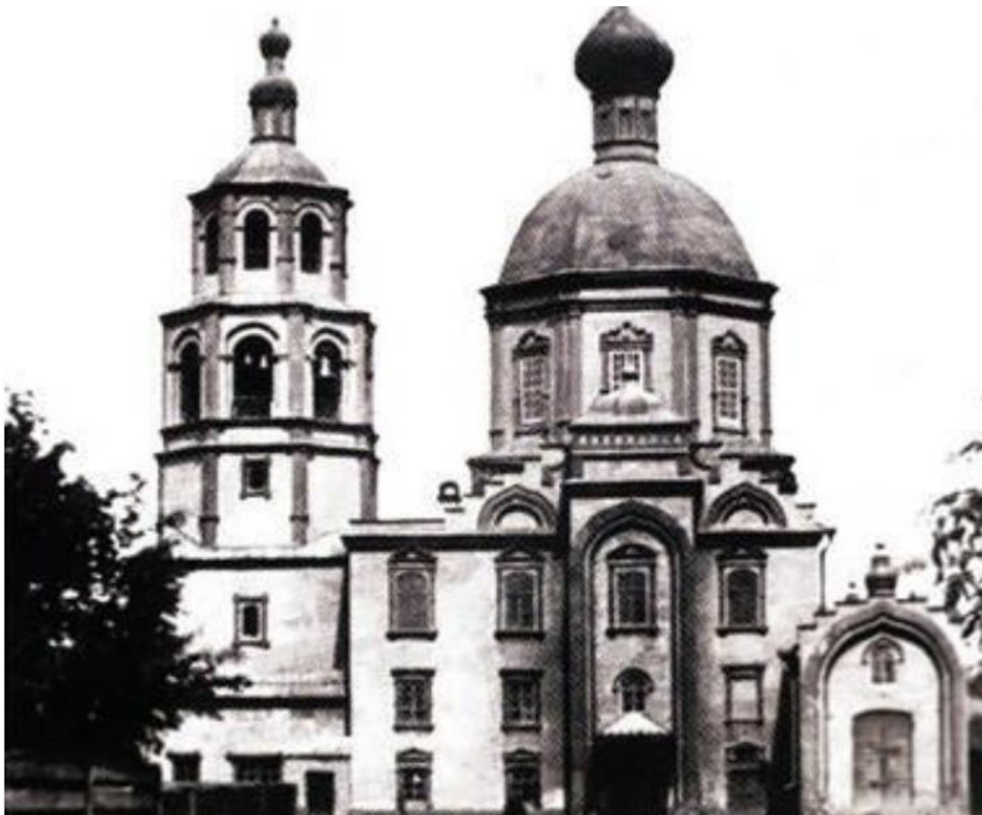
1739 – Церковь во имя Московских Чудотворцев. 1898-е гг. - часовня в имя Александре III