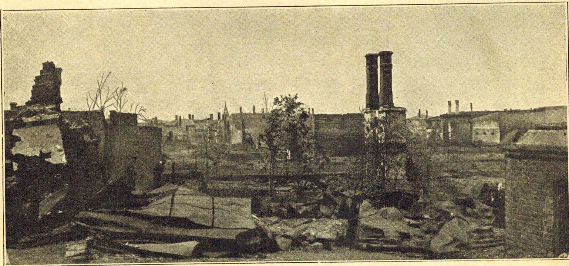
Пожары въ Казани 8-го и 9-го іюня т. г. Кварталь, прилегающій къ Мочальной площади.