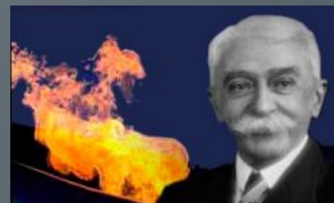
Барон Пьер де Кубертен