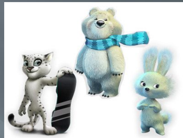
Сочи - 2014

Впоследствии каждые игры имели своего персонажа.