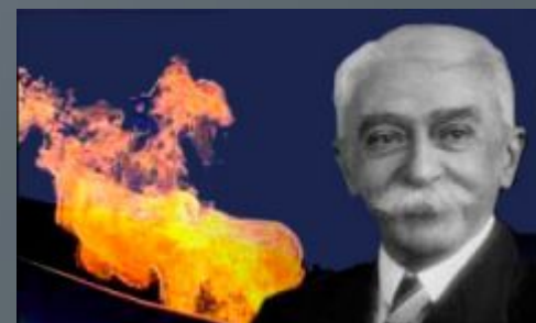
Барон Пьер де Кубертен