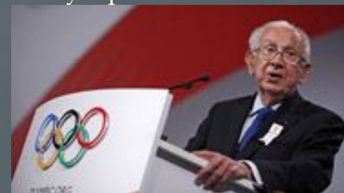
Маркиз Хуан Антонио Самаранч