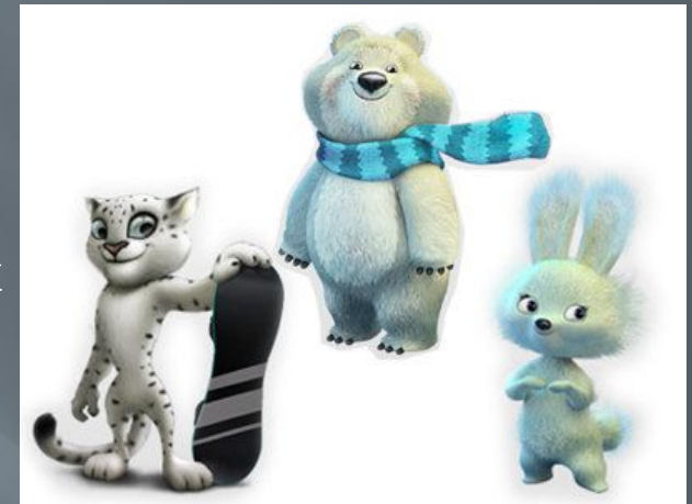
Сочи - 2014

Впоследствии каждые игры имели своего персонажа.