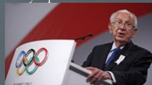
Маркиз Хуан Антонио Самаранч