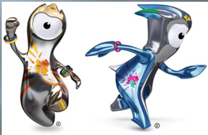
Лондон - 2012

Традиция создавать особый талисман Олимпийских игр, приносящий удачу спортсменам и болельщикам, впервые зародилась в 1968 году на соревнованиях в Мехико.