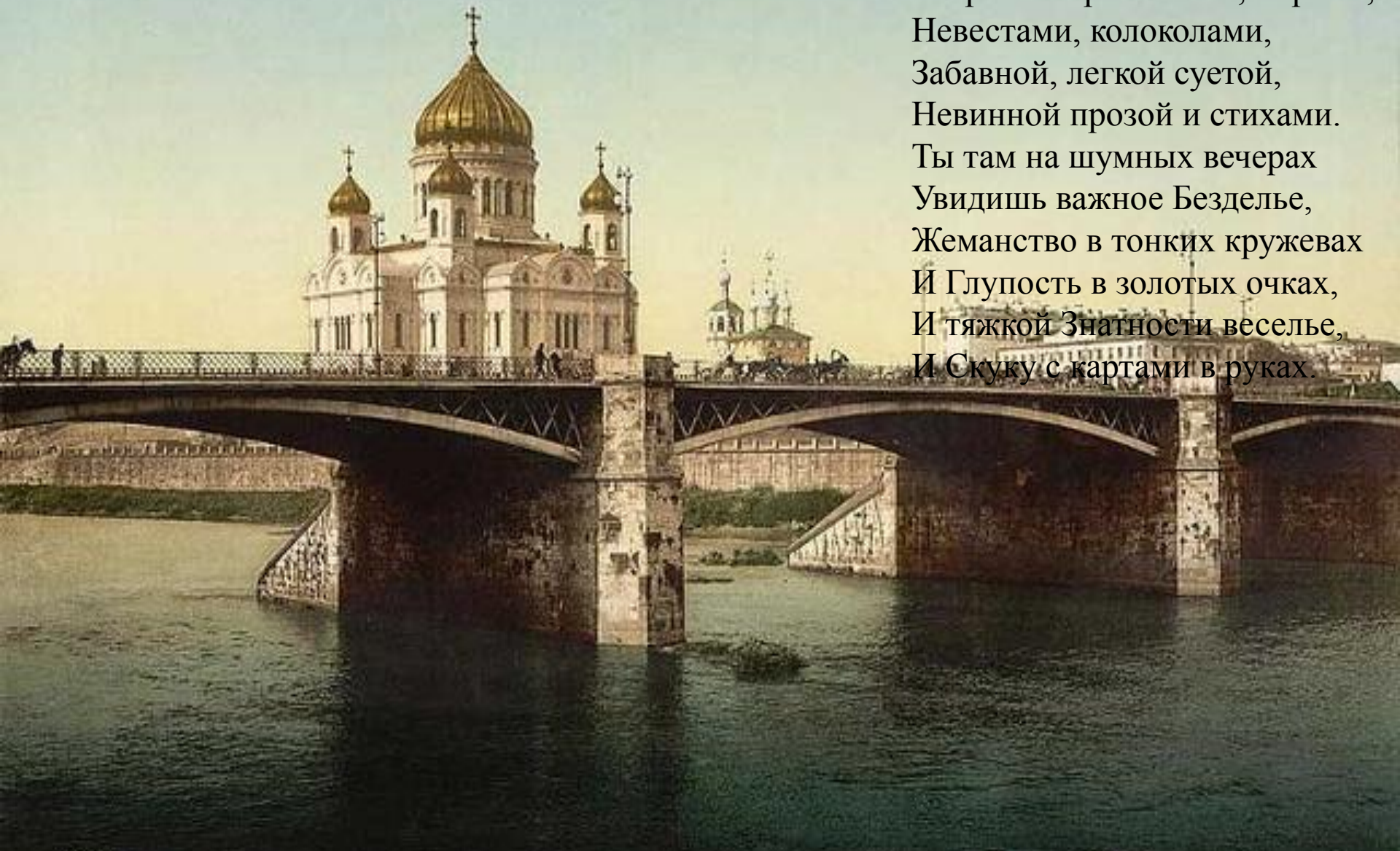
8843. P. Z. - MOSCOU. LA CATHEDRALE DU ST-SAUVEUR Москва, 1890e ET LE PONT KAMENNYI

Разнообразной и живой Москва пленяет пестротой, Старинной роскошью, пирами, Невестами, колоколами, Забавной, легкой суетой, Невинной прозой и стихами. Ты там на шумных вечерах Увидишь важное Безделье, Жеманство в тонких кружевах И Глупость в золотых очках, И тяжелой Знатности веселье, И Скуку с картами в руках.