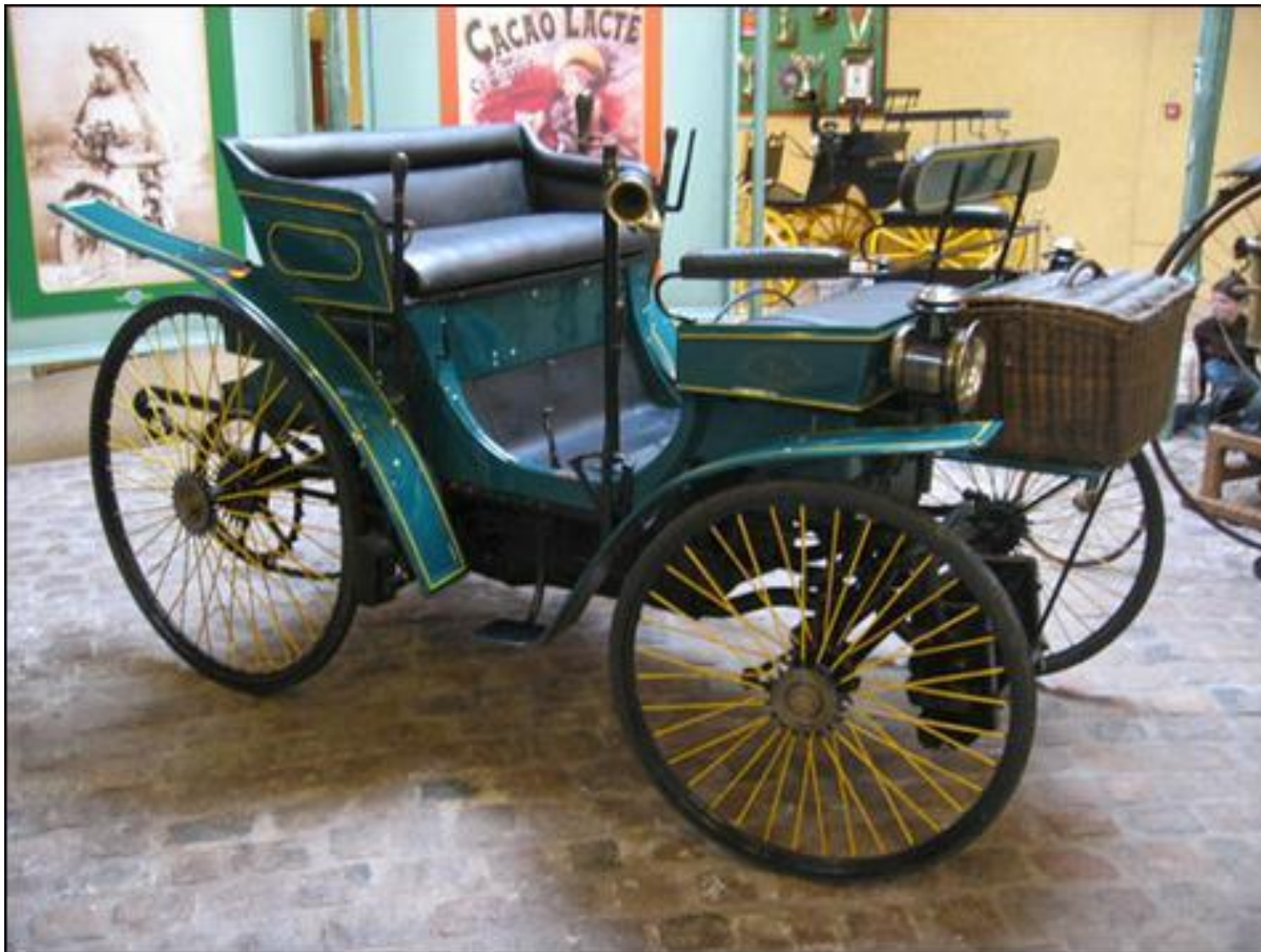
Пежо 1891 г.