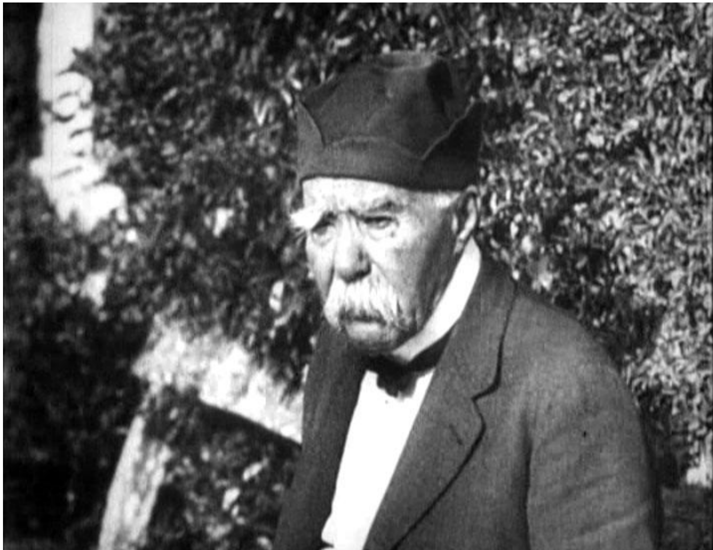
Клемансо в последние годы жизни