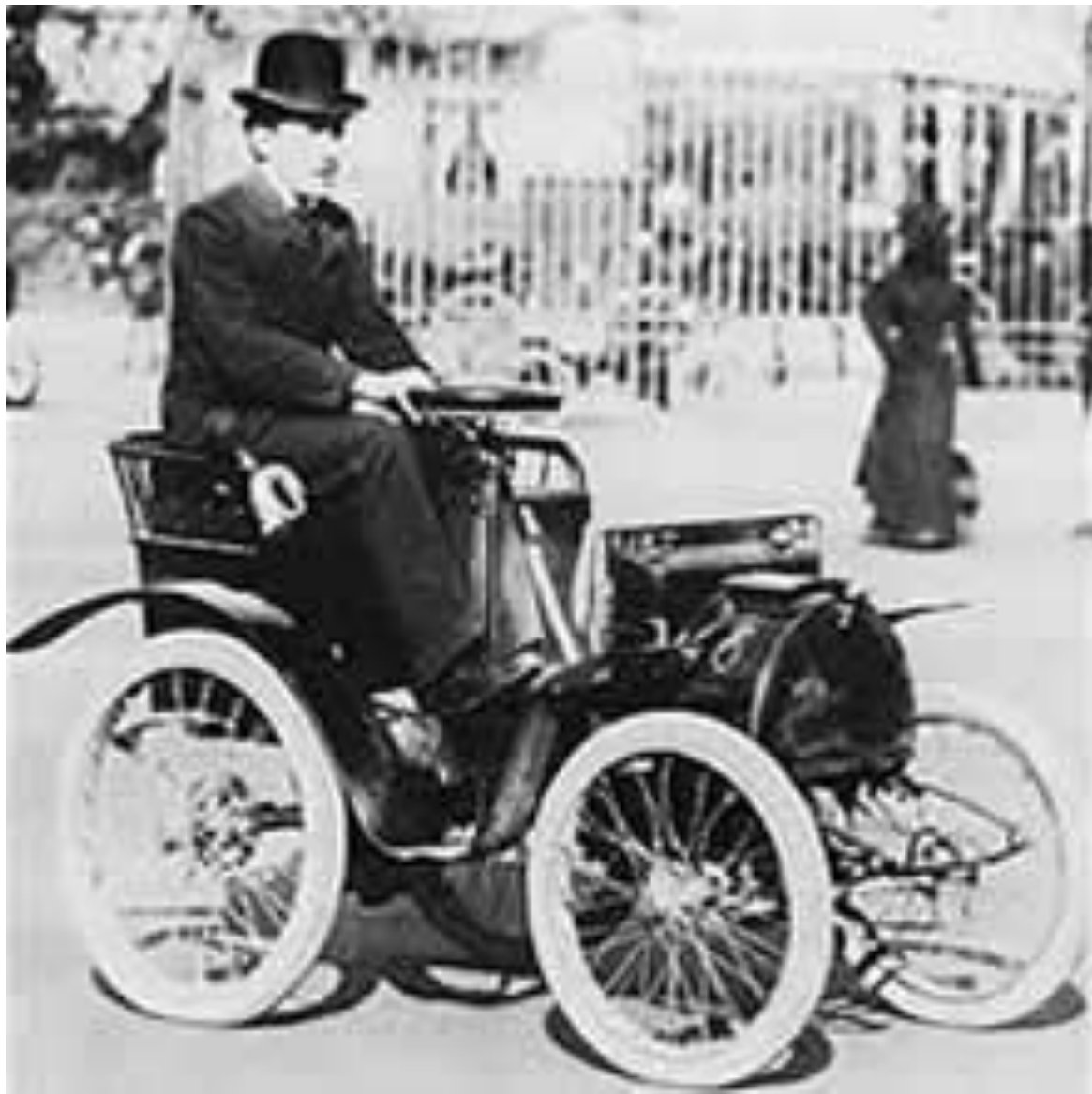
Луи Рено и его первый автомобиль