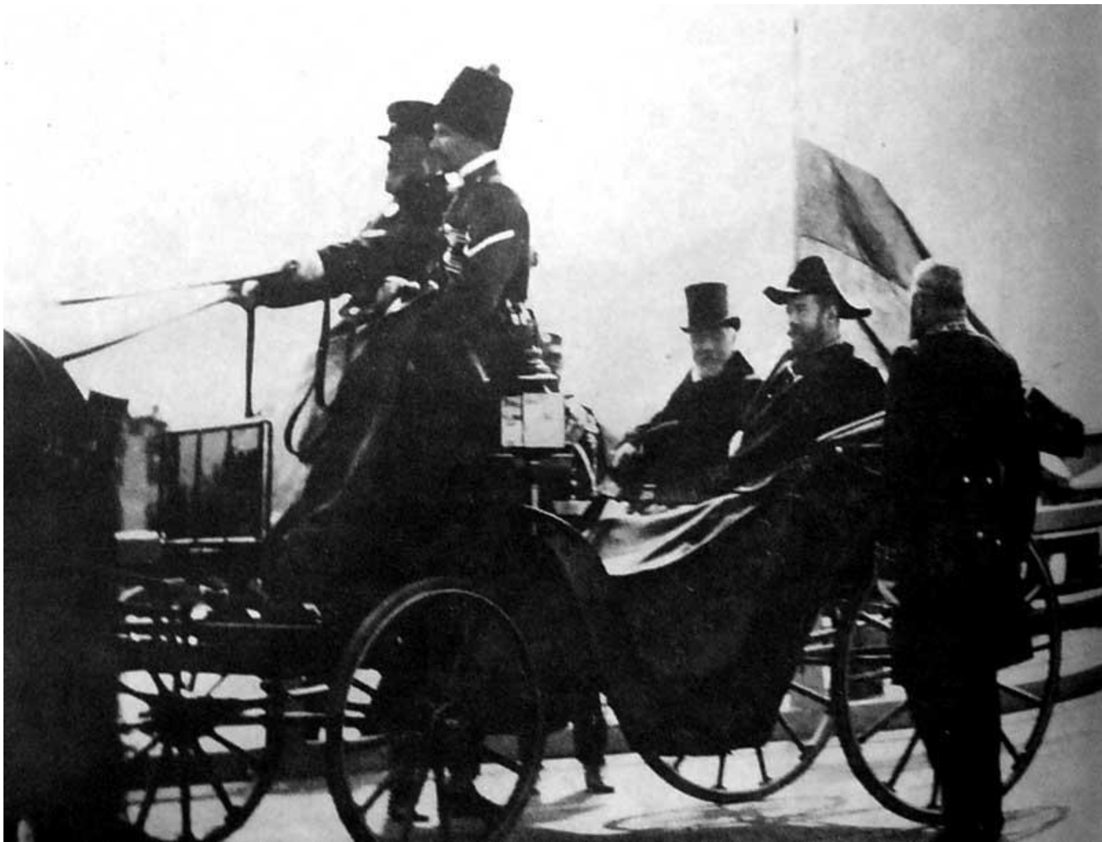
Император Николай II и президент Франции Эмиль Лубе. Петергоф 1902