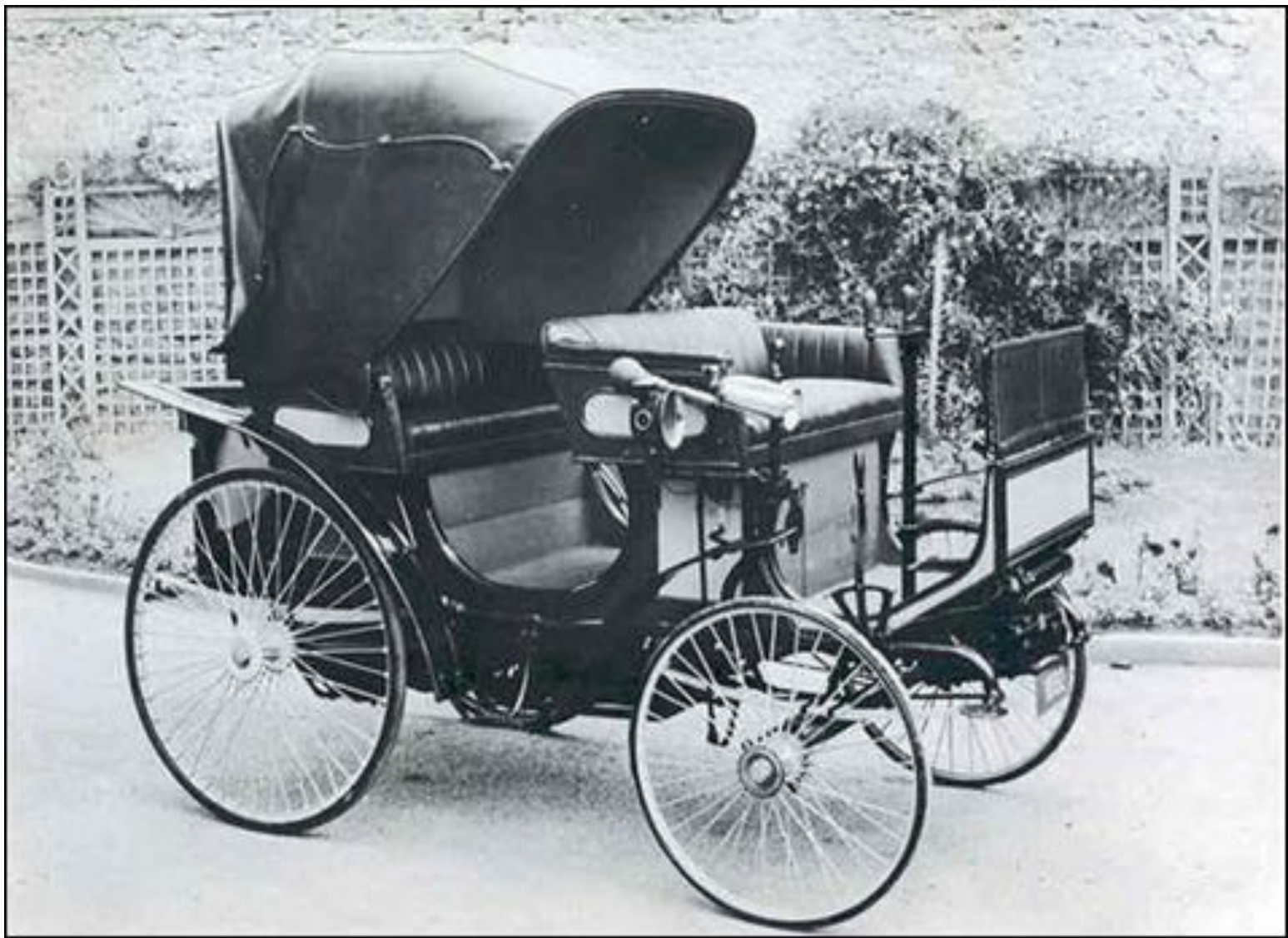
Пежо «Виктория» 1897 г.