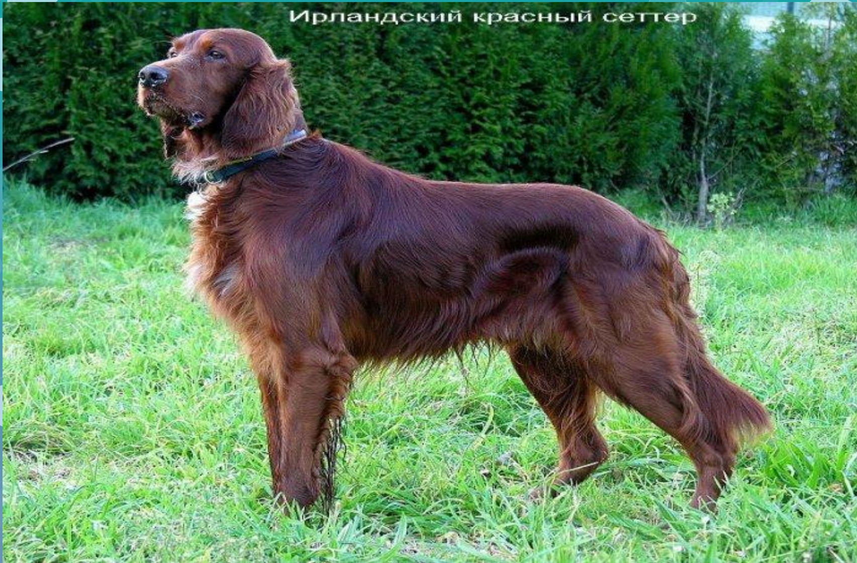
Ирландский красный сеттер