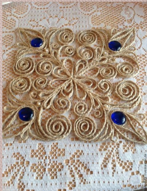
Подставка под горячие