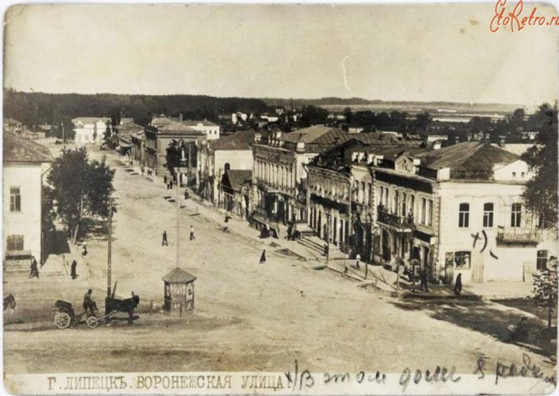
Г. ЛИПЕЦКЪ. ВОРОНЕЖСКАЯ УЛИЦА \frac{1}{3} в этом доме 8 рядов