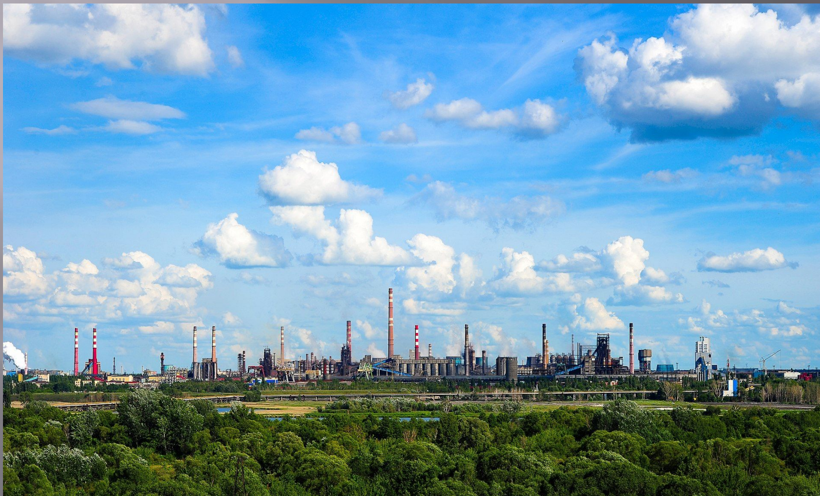
Фото основного предприятия г. Липецк- Новолипецкого металлургического комбината