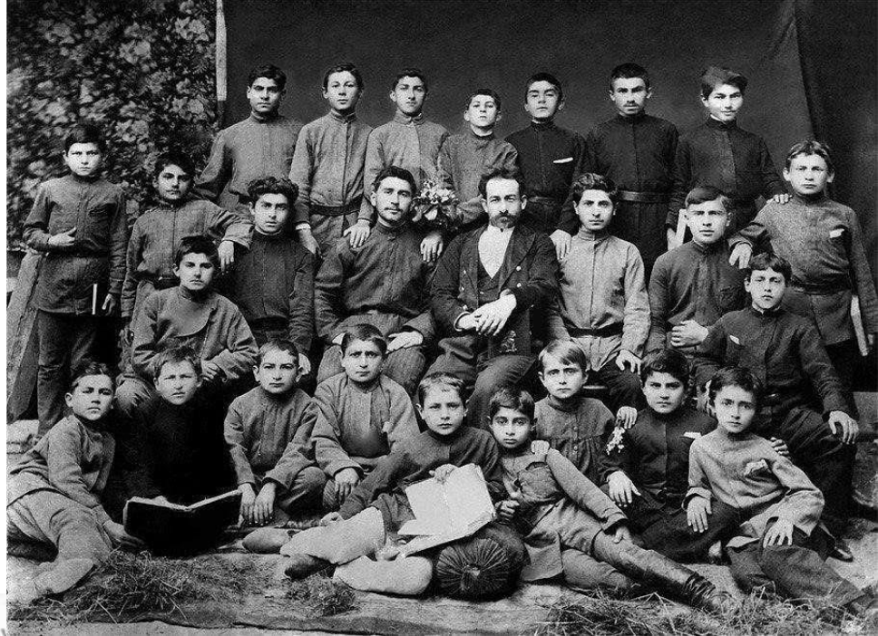
Гор. Утличь. духовное училище.

В 1893 году Иосиф Джугашвили, успешно закончив второй подготовительный класс, был принят в училище. В июле 1894 года по окончании училища Иосиф был отмечен как лучший ученик. Его аттестат содержит «пятёрки» по многим предметам. По окончании училища Иосиф был рекомендован для поступления в духовную семинарию. В сентябре 1894 года Иосиф, блестяще сдав приёмные экзамены, был зачислен в православную Тифлисскую духовную семинарию.