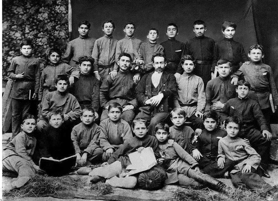
Гор. Утличь. духовное училище.

В 1893 году Иосиф Джугашвили, успешно закончив второй подготовительный класс, был принят в училище. В июле 1894 года по окончании училища Иосиф был отмечен как лучший ученик. Его аттестат содержит «пятёрки» по многим предметам. По окончании училища Иосиф был рекомендован для поступления в духовную семинарию. В сентябре 1894 года Иосиф, блестяще сдав приёмные экзамены, был зачислен в православную Тифлисскую духовную семинарию.