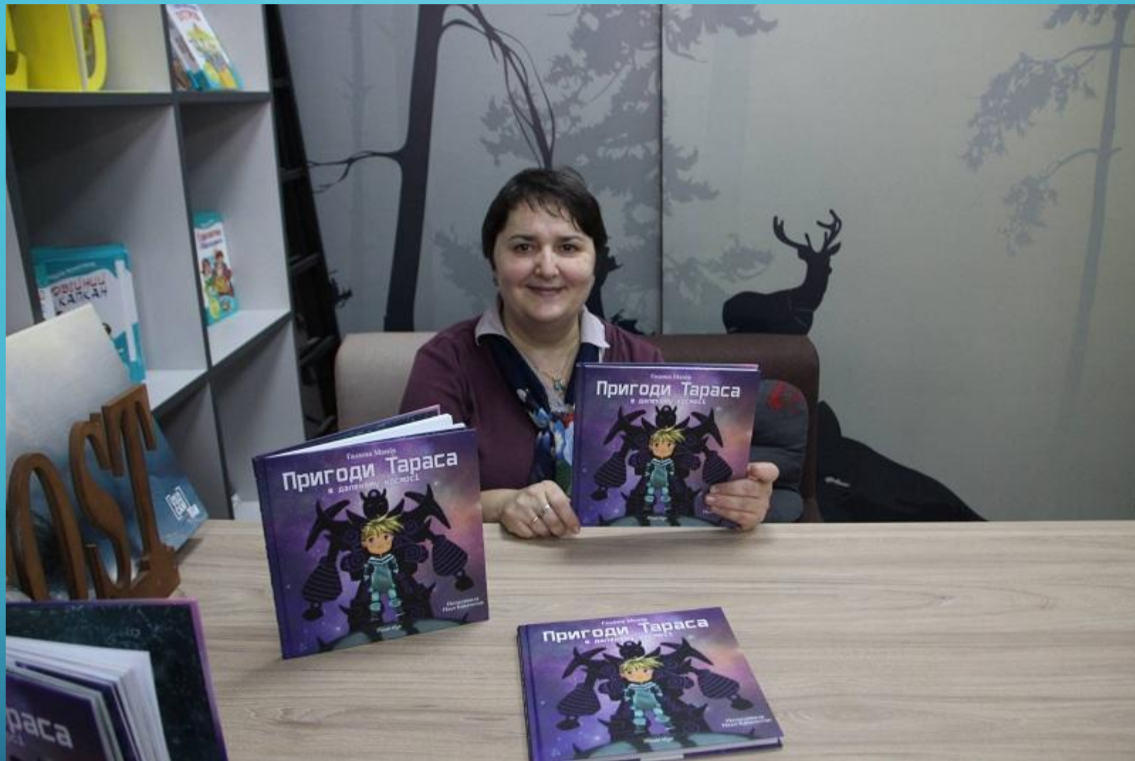
Галина Манів (Кирієнко) Українська поетеса