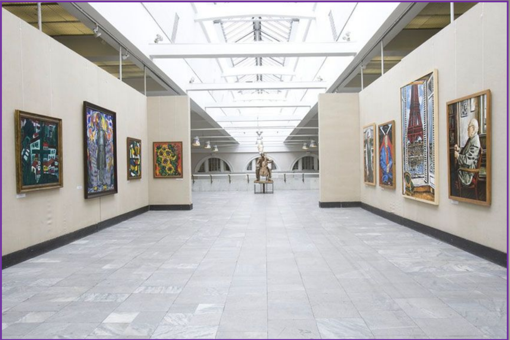
Nowadays, the Manege building houses the exhibition hall of the Union of Artists