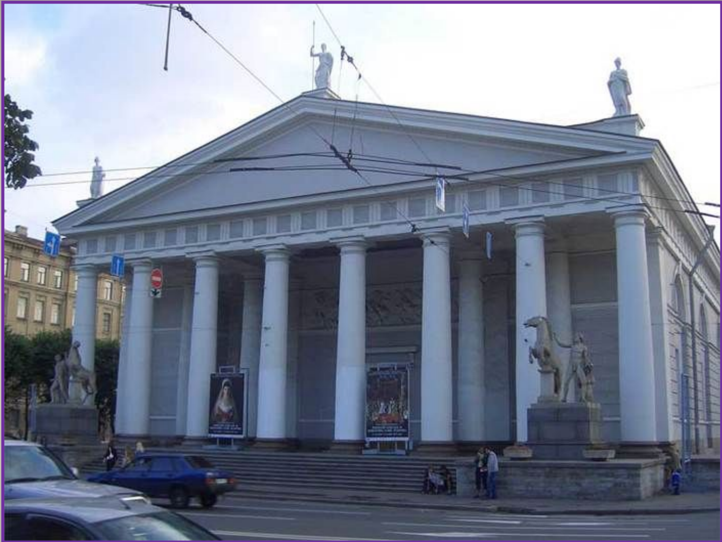
The building is situated in the south-western corner of St. Isaac's Square