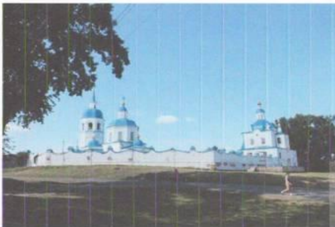
Енисейск Спасо-Преображенский мужской монастырь