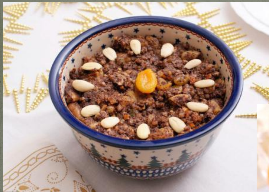
Сочиво или кутья

Готовился традиционный праздничный обед. Считалось, что на столе должно быть 12 блюд.