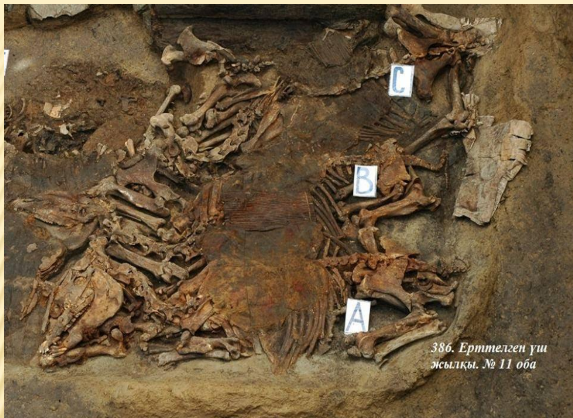
386. Ерттелген үш жылқы. № 11 оба