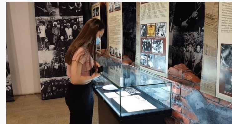
Первый посетитель по проекту «Пушкинская карта» Республиканский музей Боевой Славы