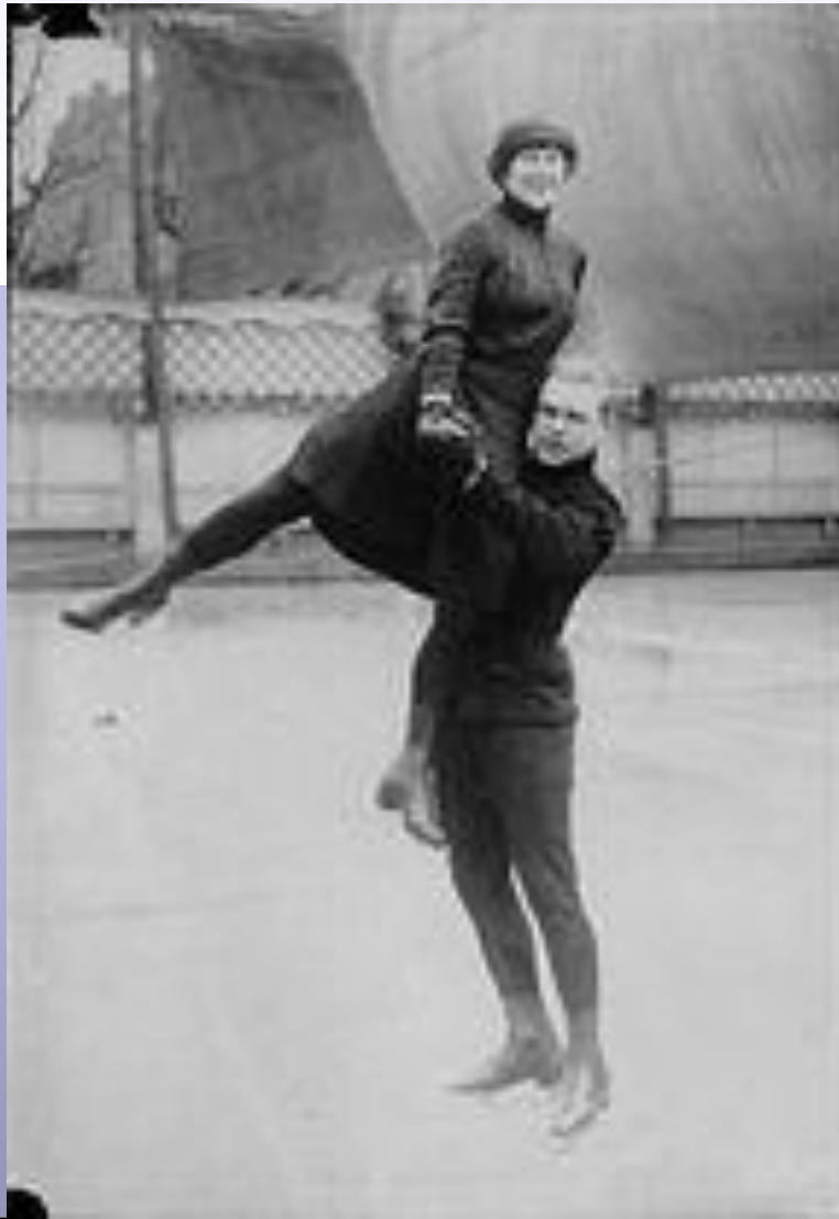
Вандела, 20. 01. 1871