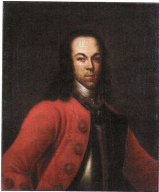
Царевич Алексей Петрович. Художник И. Таннауэр

Еще большее отчуждение сына и отца возросло после женитьбы Петра I на Марте Скавронской