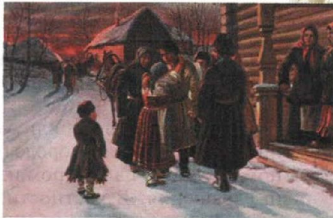
Прощание рекрута с родителями. Неизвестный художник

330 тысяч рекрутов было забрано в армию (1699- 1714гг.)