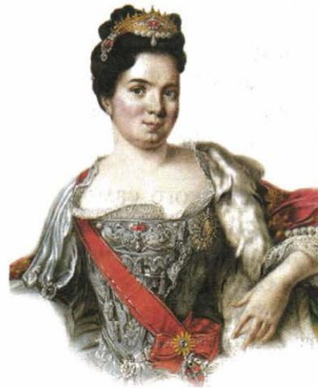
Императрица Екатерина I

( в православии Екатерина Алексеевна) – уроженке прибалтийских земель.