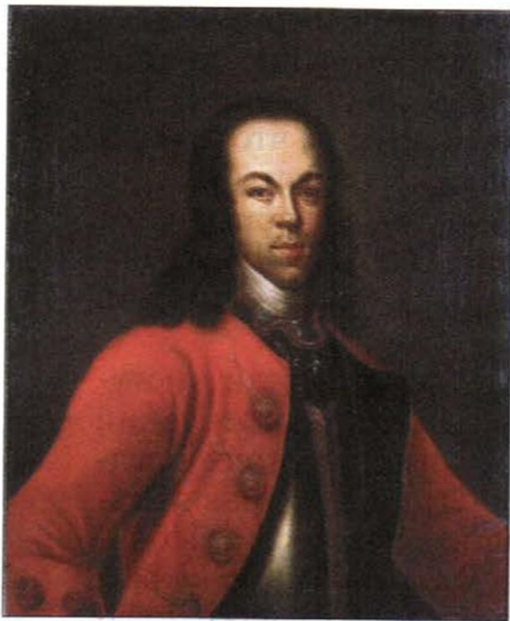
Царевич Алексей Петрович. Художник И. Таннауэр