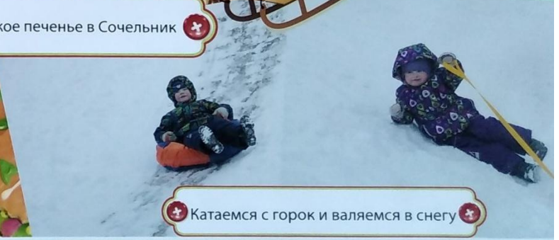
Катаемся с горок и валяемся в снегу