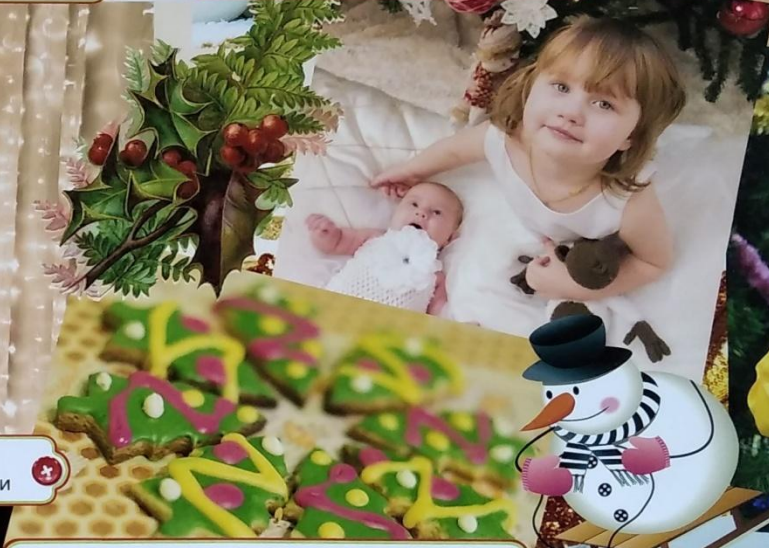
Печем Рождественское печенье в Сочельник