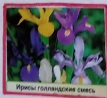
Ирисы голландские смесь