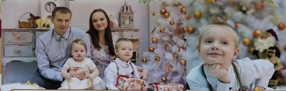
Пишем письма Деду Морозу и ждем его в гости с мешком подарков.