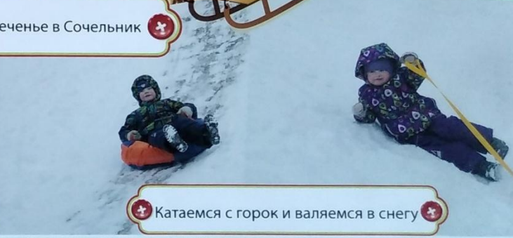
Катаемся с горок и валяемся в снегу