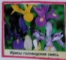
Ирисы голландские смесь