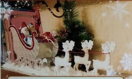
Делаем поделки :) Рисуем и раскрашиваем всей семьей :)