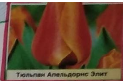
Тюльпан Апельдорис Элит