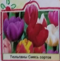
Тюльпаны Смесь сортов

Урожай собрать высокий Нам поможет агроном. Знает он посева сроки И с ботаникой знаком.