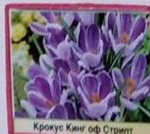
Крокус Кинг оф Стрип

Агроном - специалист сельского хозяйства, в тепличном комплексе и открытом грунте. Он хорошо разбирается в земледелии и агрономии. Эти знания помогают агроному выращивать высокие урожаи сельскохозяйственных растений. Агроном лучше других видит, как развиваются растения, чего им не хватает, какие изменения происходят в почве. Агроном контролирует уходные работы за растениями. Определяет когда и какие применять удобрения, ведёт борьбу с сорняками, болезнями и вредителями. Назначает сроки и способы посева семян, черенков, луковиц. В будущем это цветочная, овощная рассада, саженцы плодово-ягодных, декоративных культур, комнатных растений и цветов на срез. Цветочная рассада и декоративные культуры используются для благоустройства города.