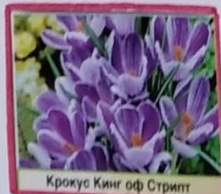
Крокус Кинг оф Стрип

Агроном - специалист сельского хозяйства, в тепличном комплексе и открытом грунте. Он хорошо разбирается в земледелии и агрономии. Эти знания помогают агроному выращивать высокие урожаи сельскохозяйственных растений. Агроном лучше других видит, как развиваются растения, чего им не хватает, какие изменения происходят в почве. Агроном контролирует уходные работы за растениями. Определяет когда и какие применять удобрения, ведёт борьбу с сорняками, болезнями и вредителями. Назначает сроки и способы посева семян, черенков, луковиц. В будущем это цветочная, овощная рассада, саженцы плодово-ягодных, декоративных культур, комнатных растений и цветов на срез. Цветочная рассада и декоративные культуры используются для благоустройства города.