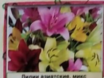
Лилии азиатские, микс