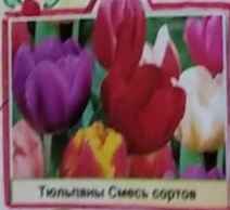
Тюльпаны Смесь сортов

Урожай собрать высокий Нам поможет агроном. Знает он посева сроки И с ботаникой знаком.