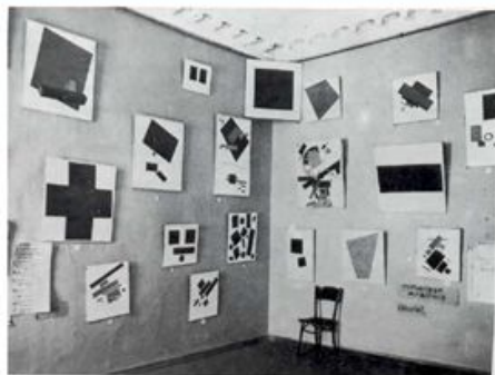
Картины К. Малевича на выставке «0,10 (ноль-десять)» в Петрограде. 1915 г.

10. «Черный квадрат» — это шарлатанство. Шарлатаны успешно дураят публику, заставляя поверить в то, чего на самом деле нет. Тех, кто им не верит, они объявляют глупыми, которым недоступно высокое и прекрасное. Всем стыдно сказать, что это фиштя, потому что засмеют. А максимально примитивному рисунку — квадрату — можно приписывать какой угодно глубокий смысл, простор для человеческой фантазии безграничен. Не понимая, в чем великий смысл «Черного квадрата», многие люди оказываются перед необходимостью его себе придумать, чтобы было чем восхищаться при рассмотрении картины.