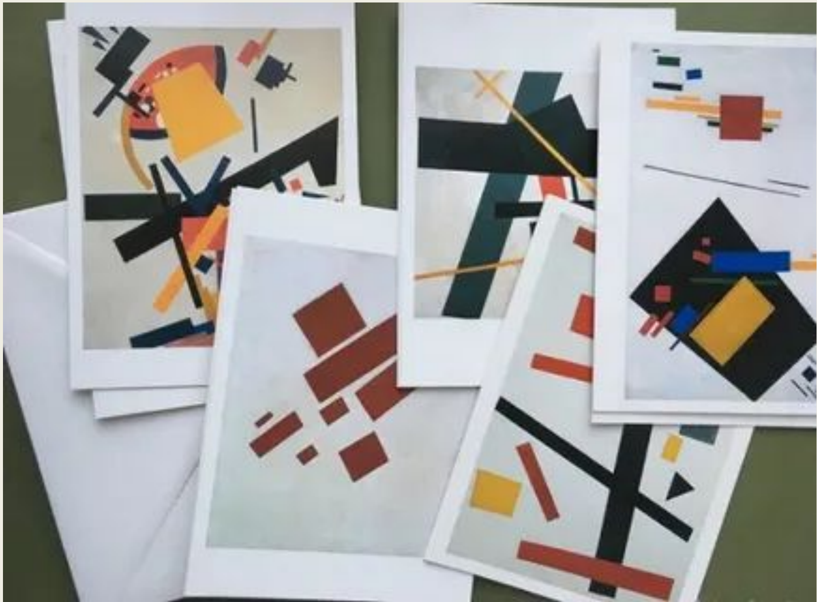
Казимир Малевич. Супрематизм