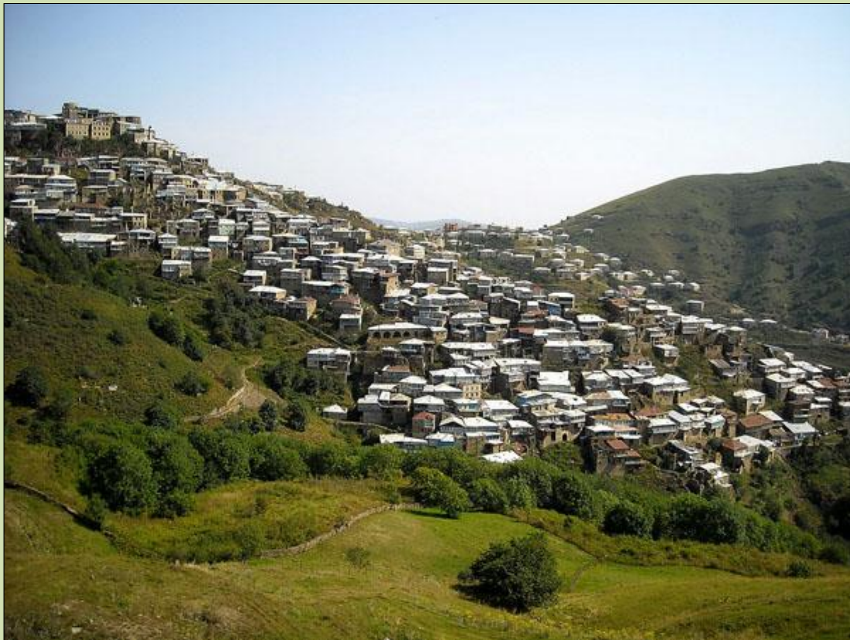
Аул в горах