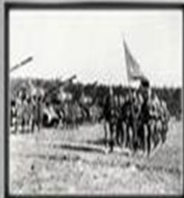
63-я ГВАРДЕЙСКАЯ ЧЕЛЯБИНСКАЯ ТАНКОВАЯ БРИГАДА