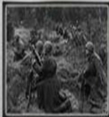
299-й ГВАРДЕЙСКИЙ МИНОМЕТНЫЙ ПОЛК