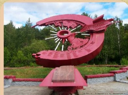
Памятник разведчикам-мотоциклистам Уральского добровольческого танкового корпуса

Не знаю, что б стало в полях под Москвою, На Курской дуге, где металл закипал. Когда б не уральцы- рабочий и воин, Что вместе взошли на один пьедестал.