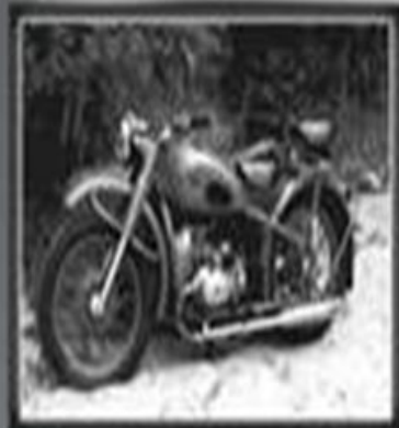
7-й ГВАРДЕЙСКИЙ МОТОЦИКЛЕТНЫЙ БАТАЛЬОН