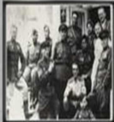
29-я ГВАРДЕЙСКАЯ МОТОСТРЕЛКОВАЯ БРИГАДА