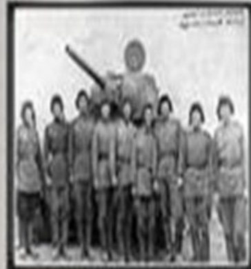
61-я ГВАРДЕЙСКАЯ СВЕРДЛОВСКАЯ ТАНКОВАЯ БРИГАДА