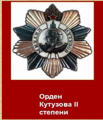
Орден Кутузова II степени