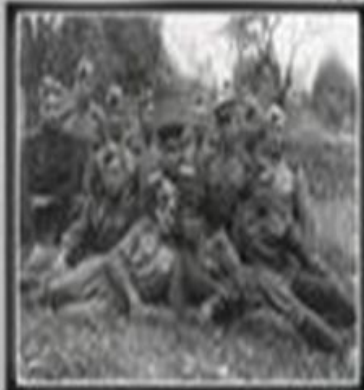
62-я ГВАРДЕЙСКАЯ МОЛОТОВСКАЯ ТАНКОВАЯ БРИГАДА