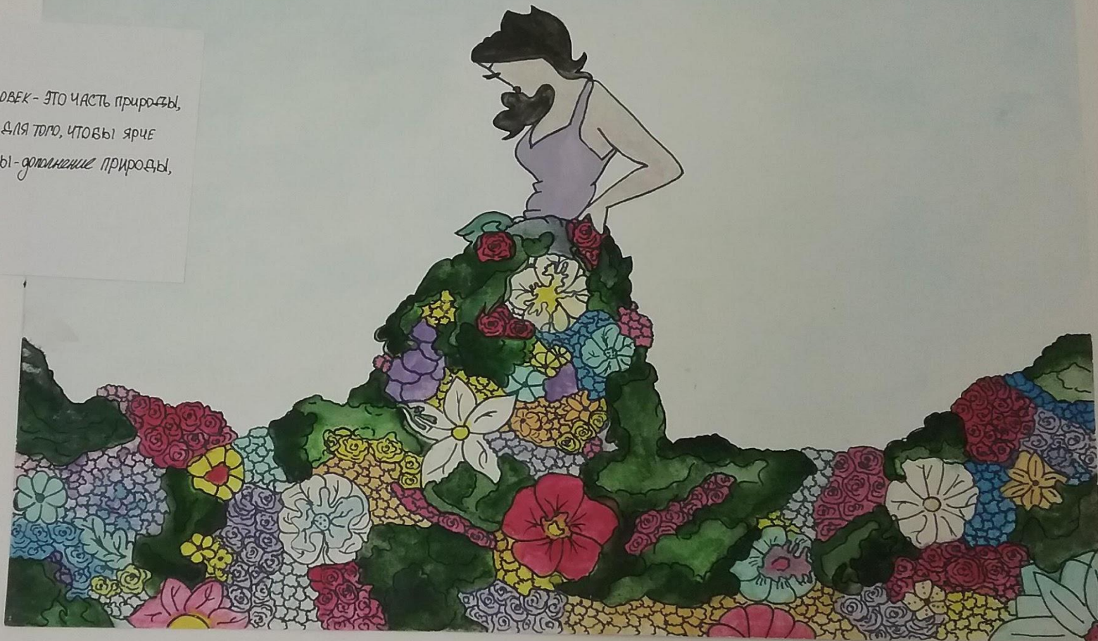
Антоненко Дарья 14 лет «Метаморфозы в одежде»

Этим рисунком я хотела показать, что человек - это часть природы, её дополнение . Блеклый фон был сделан для того, чтобы ярче всего выделялись цветы . Помни , что ты - дополнение природы, а природа - дополнение ТЕБЯ .