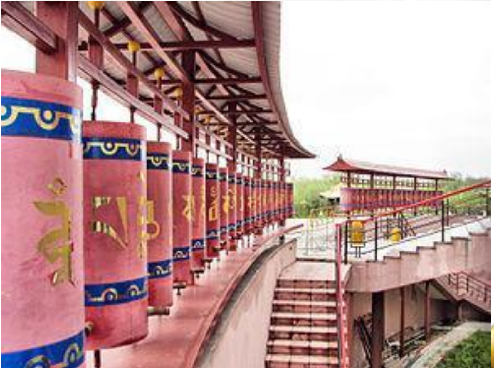
Золотая обитель Будды Шакьямуни, Кашмир