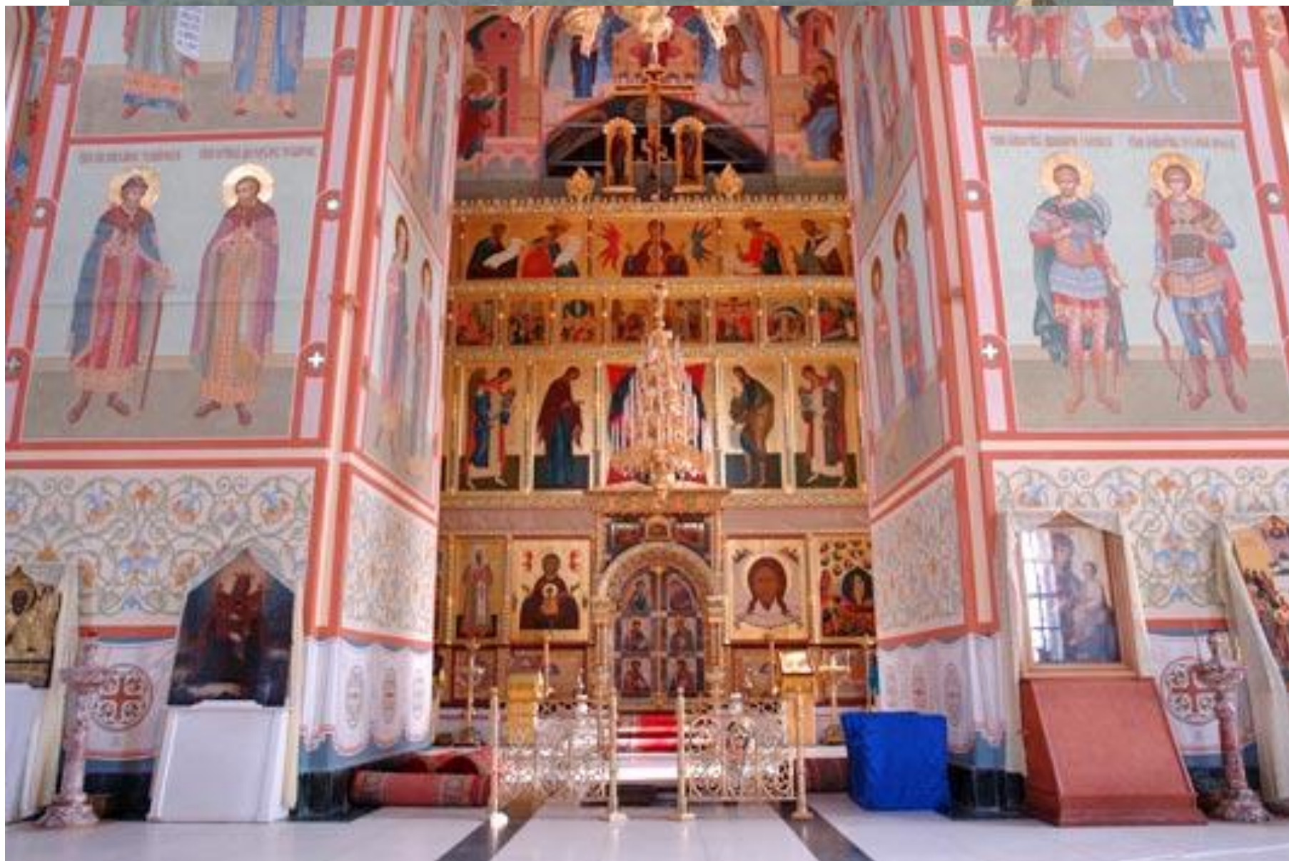
Софийско- Успенский собор в Тобольском Кремле