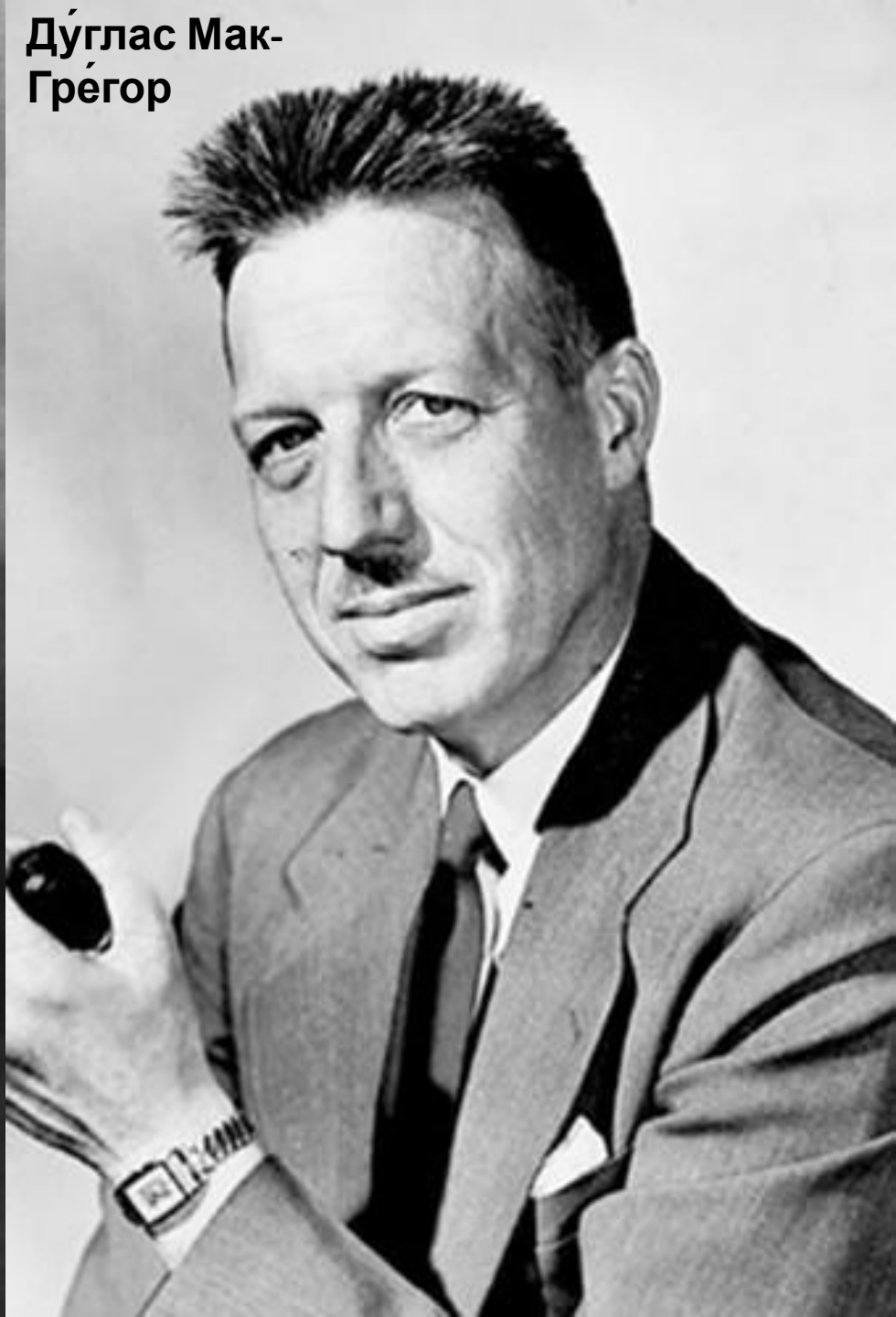
Дуглас Мак- Грегор