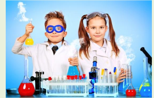
Научные мастер -классы и лаборатории