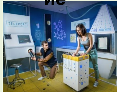
Научно- развлекательные квесты