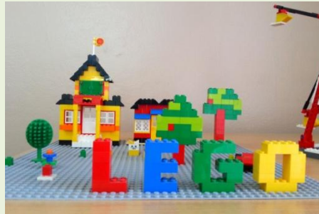
Lego- конструирован ие