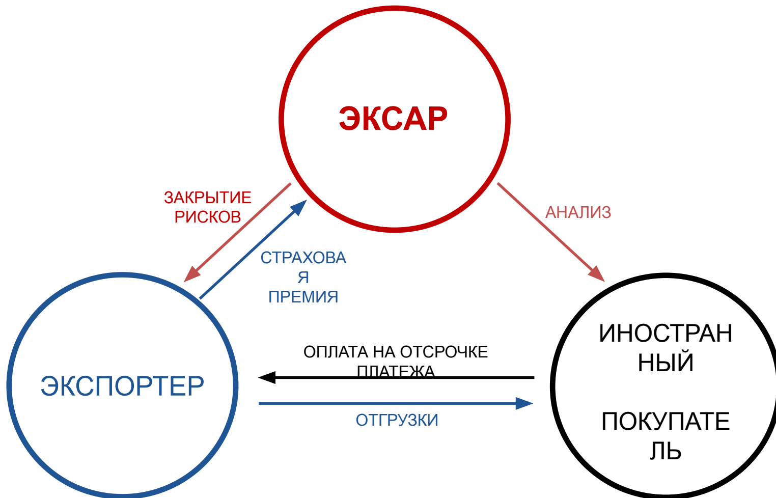
СХЕМА РАБОТЫ СТРАХОВАНИЯ ЭКСАР