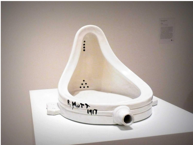
Фонтан с автографом Марселя Дюшана

В 2004 году британские художники назвали "Фонтан" самым важным предметом искусства XX века