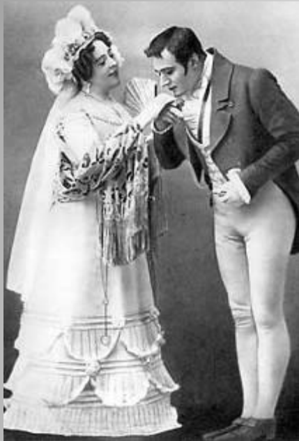
Молчалин и дамы