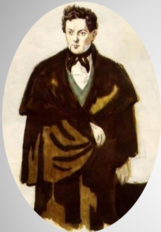
«Мильон терзаний» А.А. Чацкого