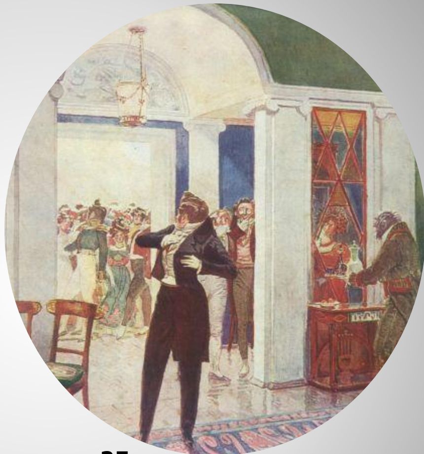
«25 глупцов на одного умного человека» А.С. Грибоедов