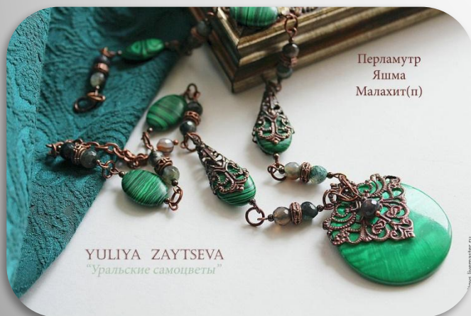
Перламутр Яшма Малахит(п)