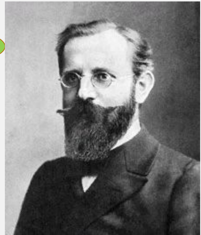
Вільгельм-Август Лай «Експериментальна педагогіка»

«Школа дії» – різнобічна діяльність, куди входить як складова частина й продуктивна праця.