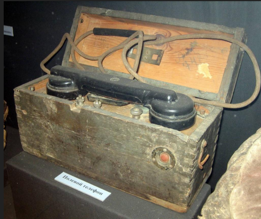
Телефонные аппараты УНА