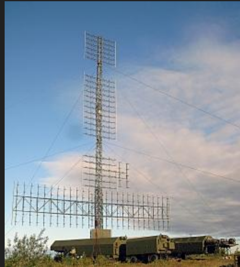
РАС 55Ж6-УЕ («НЕБО-УЕ»)