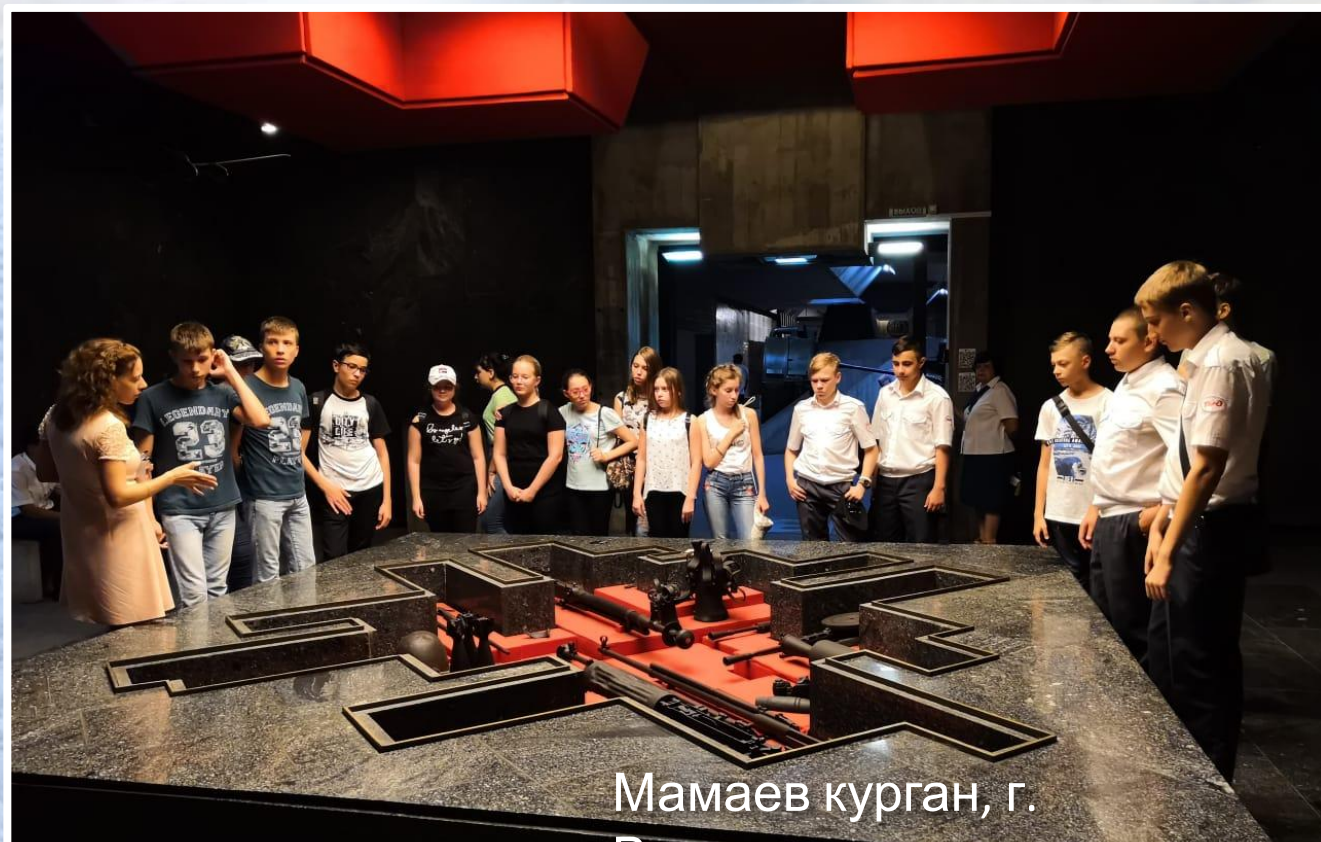
Мамаев курган, г. Волгоград