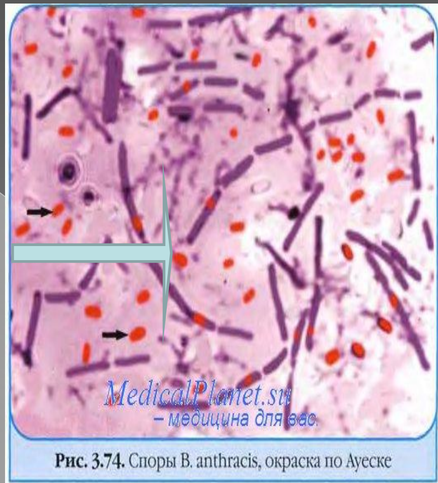
Рис. 3.74. Споры B. anthracis , окраска по Аюеске