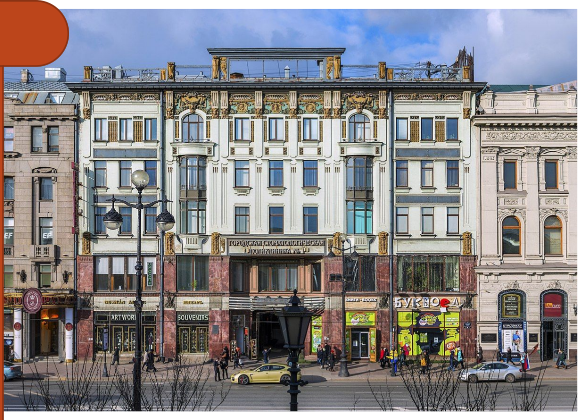
МКБ Современный вид здания (2016 год)

Первые банки в России появились еще в середине XVIIIв. – Московский дворянский банк и Петербургский купеческий банк. А в 1860 – Государственный банк. Во второй половине XIXв. Возникли коммерческие банки. В современной России коммерческие банки получили развитие с 1988г. И положили начало ликвидации государственной монополии на банковскую деятельность.